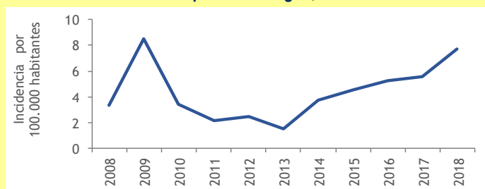
Gráfico 2. Hepatitis C por grupos de edad y sexo. Aragón, 2018