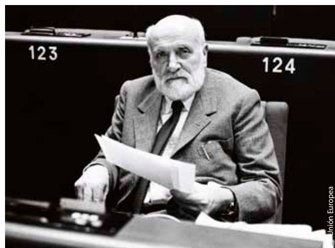
Spinelli en el Parlamento Europeo, poco después de que aprobara su plan para una Europa federal en 1984.

El 14 de febrero de 1984, el Parlamento Europeo aprobó por aplastante mayoría el «Proyecto de Tratado por el que se establece la Unión Europea», el denominado «Plan Spinelli». Aunque finalmente los Parlamentos nacionales no apoyaron el tratado, el documento sirvió de base para el Acta Única Europea de 1986, que abrió las fronteras nacionales para el mercado común, y para el Tratado de Maastricht de 1992 por el que se creó la Unión Europea. El entusiasmo de Spinelli convenció al Presidente francés Mitterrand de que acabase con la hostilidad francesa hacia cualquier cosa que no fuese un enfoque intergubernamental de Europa. Esto dio a varios Gobiernos europeos el impulso que necesitaban para avanzar aún más con el proceso de integración europea.