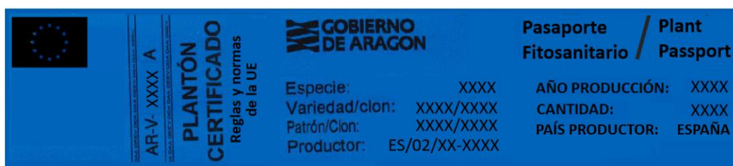
Modelo etiqueta certificada plantón de frutales.

Otra de las novedades que plantea el reglamento es la emisión combinada de los pasaportes fitosanitario y las etiquetas del sistema de certificación, de tal forma que la etiqueta de planta certificada pueda servir de pasaporte fitosanitarios. Para ello deben cumplir con una serie de requisitos por lo que plantean los siguientes modelos de etiquetas según la especie: