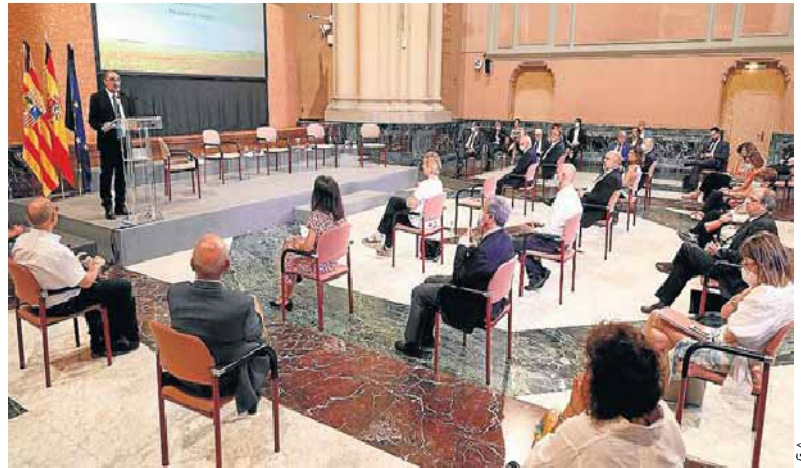
El informe del Consejo fue presentado ayer en la sede del Gobierno de Aragón.

En el primer trimestre de 2020, la producción de la comu-