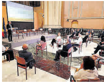
►► Presentación del informe del CESA.

►► El Consejo Económico y Social de Aragón presentó ayer el informe anual en una jornada que sirvió para dar a conocer las previsiones de crecimiento de la economía aragonesa en los próximos meses. Y estas, como está ocurriendo en todos los sitios y en todos los foros, tampoco son muy esperanzadoras. Se estima que el PIB caerá un 9,5% y que la recuperación tardará al menos tres años. El único dato mínimamente optimista es que la caída será dos puntos menor que en el resto de España, por la fortaleza de la economía regional. Aunque no sirve de consuelo, debe servir de estímulo