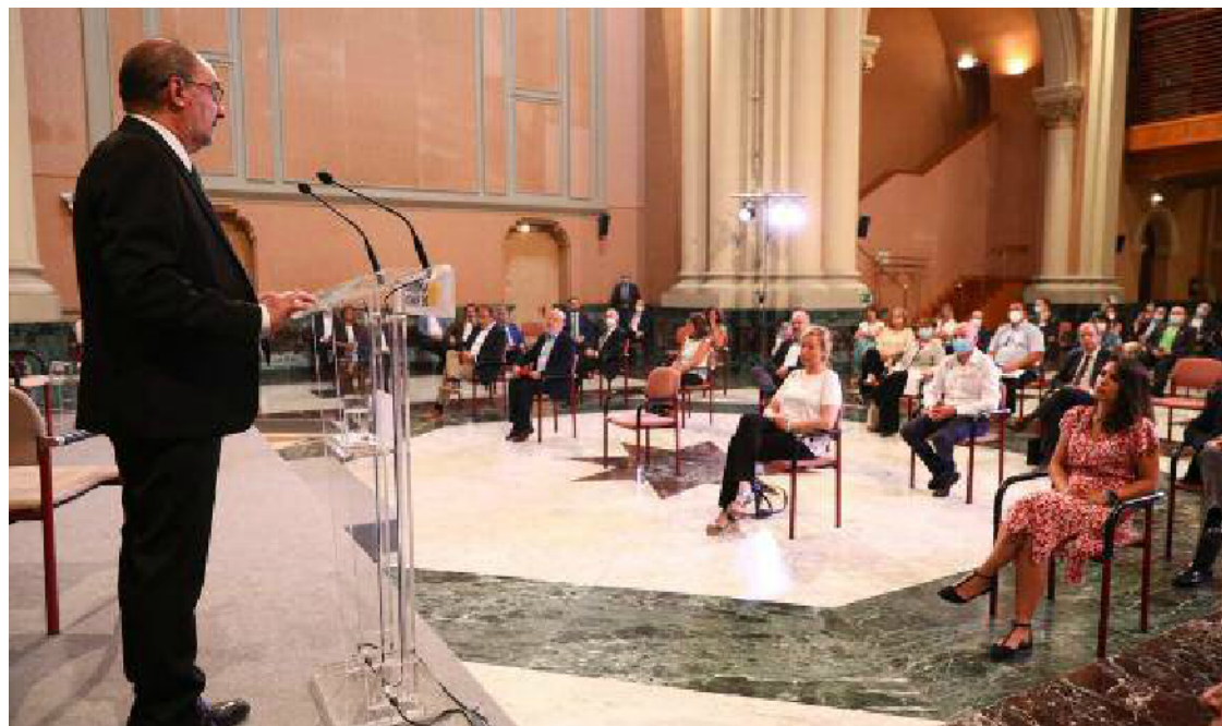
El presidente del Gobierno de Aragón, Javier Lambán, interviene en la jornada sobre la situación socioeconómica y la presentación del informe anual del CESA

El presidente de Aragón, Javier Lambán, comenzó su intervención señalando que la elección del ministro irlandés de Finanzas, Paschal Donohoe, como presidente del Eurogrupo es una