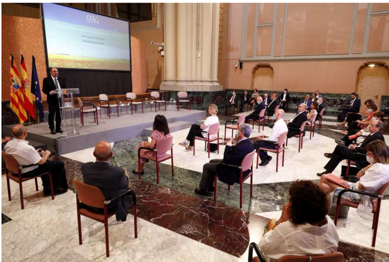
Presentación del informe anual del Consejo Económico y Social de Aragón