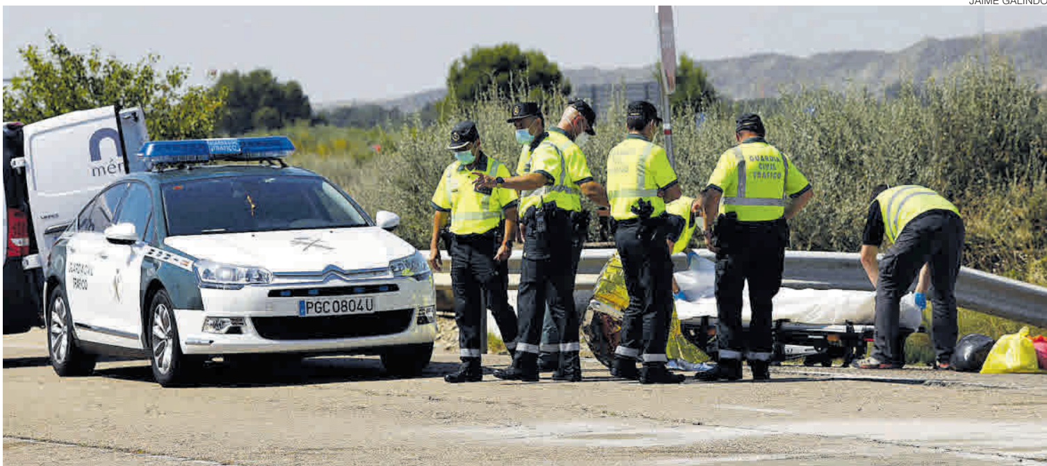
FALLECE UN AGENTE DE LA GUARDIA CIVIL DE TRÁFICO EN ACTO DE SERVICIO. Un miembro de la Benemérita perteneciente a la agrupación de Zaragoza falleció ayer en Zuera tras colisionar con un camión. La víctima, de 39 años, se dirigía junto a otros compañeros para socorrer a una persona que había volcado con un tractor en la N-330. ARAGÓN ▶ Página 18

ECONOMÍA El CESA prevé una caída del PIB del 9,5% y que la crisis llegue al 2023 ARAGÓN ▶ Página 10