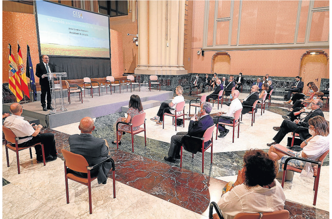
Javier Lambán, ayer en la presentación en la sala de la Corona del Pignatelli del informe del CESA.

El catedrático y exconsejero de economía del Gobierno aragonés subrayó que el elemento determinante en la recuperación, además del sanitario, será la confianza del consumidor. «Si no la recuperamos, no recuperaremos el crecimiento», advirtió. «Puede producirse un shock de incertidumbre y con miedo la gente no gasta». Y lo evidenció con el dato de que la previsión de tasa de ahorro de las familias este año es de un 16% o 17%, más elevada in-