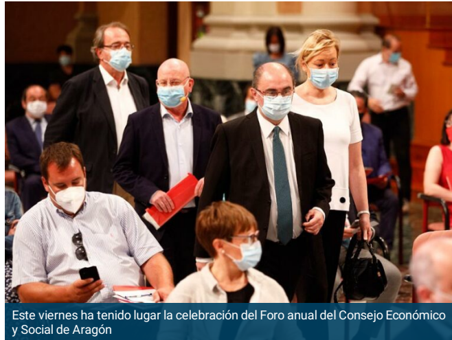
Este viernes ha tenido lugar la celebración del Foro anual del Consejo Económico y Social de Aragón

La pandemia de la Covid-19 sometió al mundo a una encrucijada de difícil salida, provocando un maremágnum de inestabilidad en sus distintas estructuras socioeconómicas. Hace escasamente un mes que Aragón se adentraba en la llamada Nueva Normalidad, y, a día de hoy, a punto de ponerse en marcha la Estrategia por la Recuperación, expertos en la materia continúan radiografiando la injerencia del coronavirus en el tejido productivo, laboral y social del territorio, cuyos efectos han impuesto un permanente periodo de incertidumbre. La economía entró “en estado shock”. Sin embargo, aseguran los expertos que Aragón ha sabido sortear los “desafíos” con destreza, trazando una senda de “resiliencia” desde una encomiable maestría.