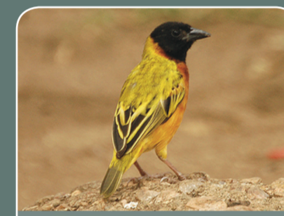
Tejedor de cabeza negra ( Ploceus melanocephalus )