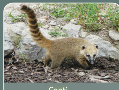
Coatí ( Nasua spp. )