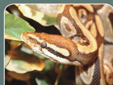
Pitón real ( Python regius )