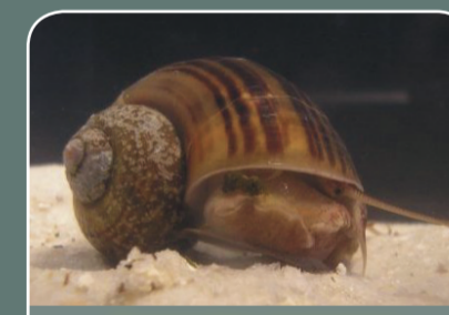
Caracoles manzana y otros (Familia Ampullariidae)