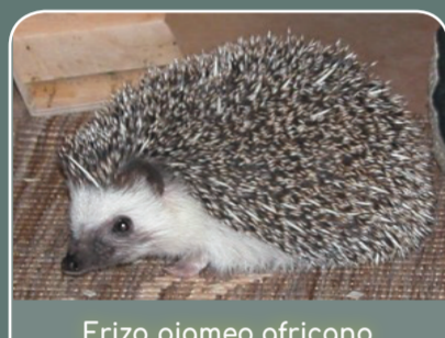
Erizo pigmeo africano ( Atelerix albiventris )