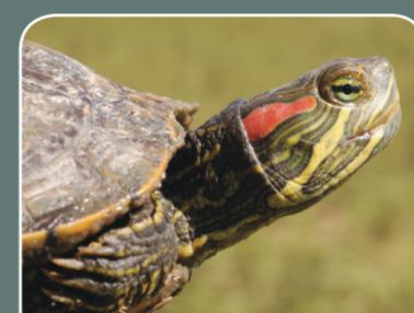
Galápago de Florida ( Trachemys scripta )