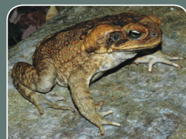
Sapo marino ( Bufo marinus )