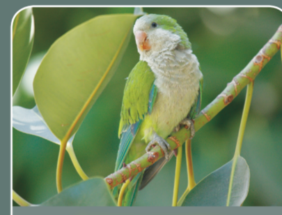
Cotorra argentina ( Myopsitta monachus )