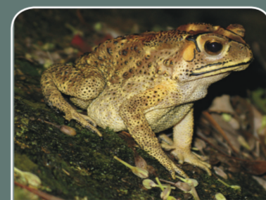
Sapo común asiático ( Duttaphrynus melanostictus )