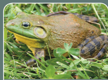
Rana toro ( Lithobates catesbeiana )