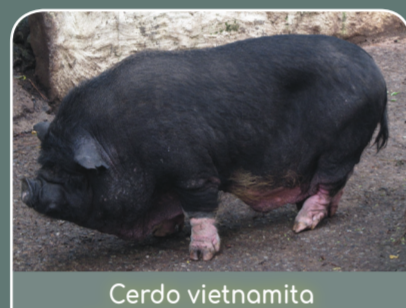
Cerdo vietnamita ( Sus scrofa domestica raza vietnamita)