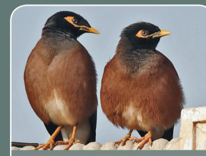
Minás ( Acridotheres spp. )