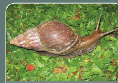
Caracol gigante africano ( Achatina fulica )