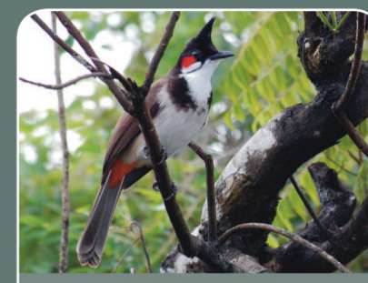
Bulbul orfeo ( Pycnonotus jocosus )