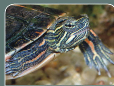
Tortuga pintada ( Chrysemys picta )