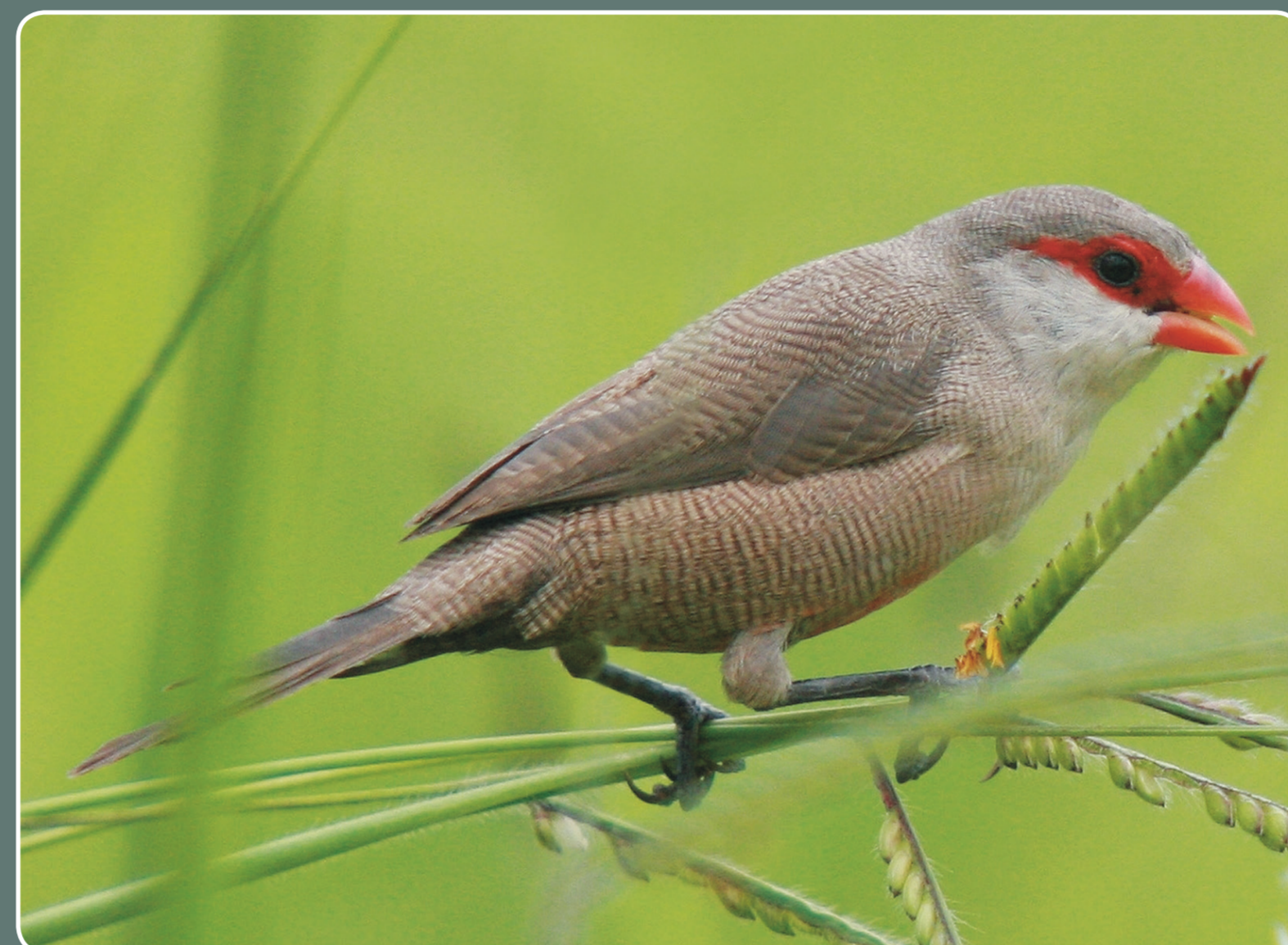
Pico de coral ( Strilda spp. )

Catálogo Español de Especies Exóticas invasoras (RD. 630/2013) https://www.invasara.es