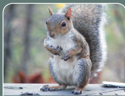
Ardillas (salvo Ardillo rojo)