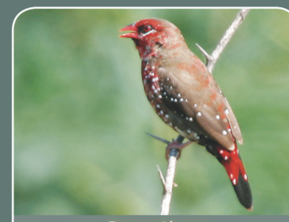
Bengali rojo ( Amandava amandava )