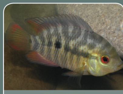
Chanchito ( Australoheros facetus )