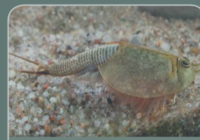
Triops de cola larga ( Triops longicaudatus )