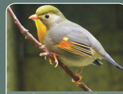
Ruisseñor del Japón ( Leiothrix lutea )