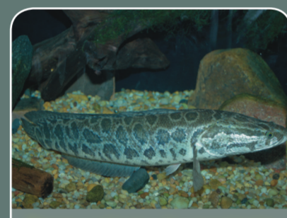
Peces cabeza de serpiente ( Channa spp. )

¡Nunca liberes tu mascota exótica en el medio natural!