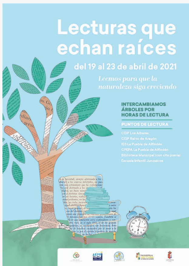
Lecturas que echan raíces