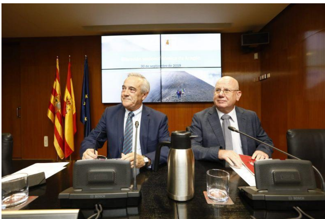
El presidente de las Cortes de Aragón, Javier Sada, junto con el presidente del CESA, José Manuel Lasiera.

El CESA avisa de que las cifras del mercado laboral están «lejos» de las del 2008