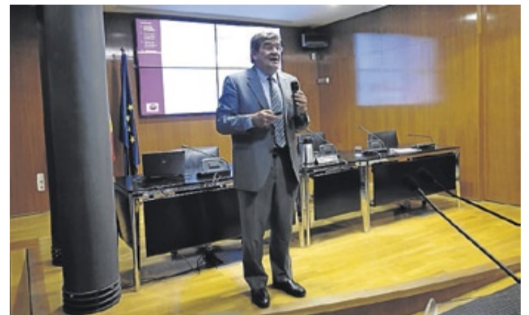
► El presidente de la Airef, José Luis Escrivá, ayer en la Aljafería.

«Para reponer la mano de obra que vamos a perder como consecuencia del envejecimiento de la población y la caída de la natalidad vamos a necesitar que lleguen inmigrantes; si no, nos empobreceremos como país», indicó Escrivá en la sala Goya del palacio de la Aljafería. A este respecto, apuntó que el país debe aprovechar que, en