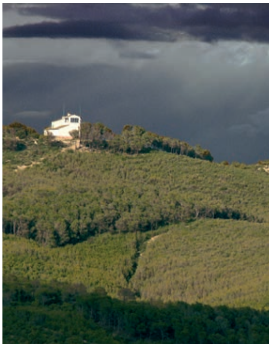
Palomera y Monte de Zuera.