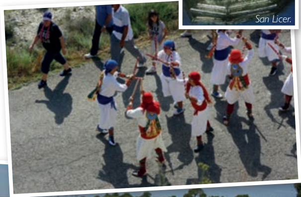
Danzantes para la Ermita del Salz.