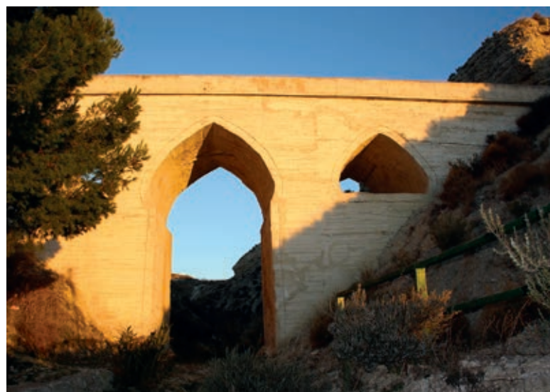
Arco de la Mora.

Esta singular construcción, restaurada según los métodos y con los mismos materiales que se usaban hace 1.000 años, se enmarca dentro del sistema arquitectónico Zagrí, basado en el empleo de ladrillo y yeso.