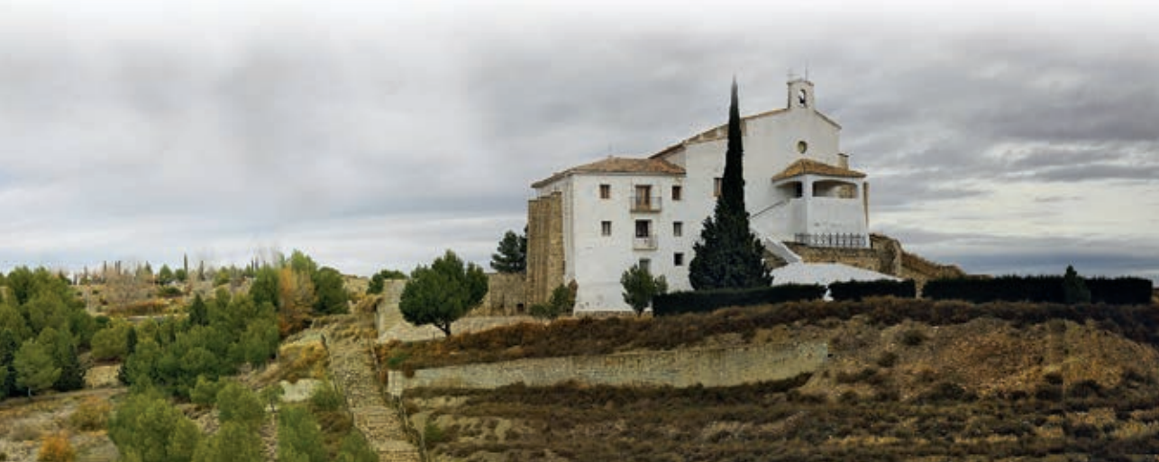
Ermita del Salz.

El ecosistema del pinar representa una importante reserva faunística, en la que podemos encontrar especies como el jabalí, el zorro, la liebre y numerosas aves como collalbas, curucas, bisbitas, perdices, cernícalos, milanos reales, milanos negros y buitres común.