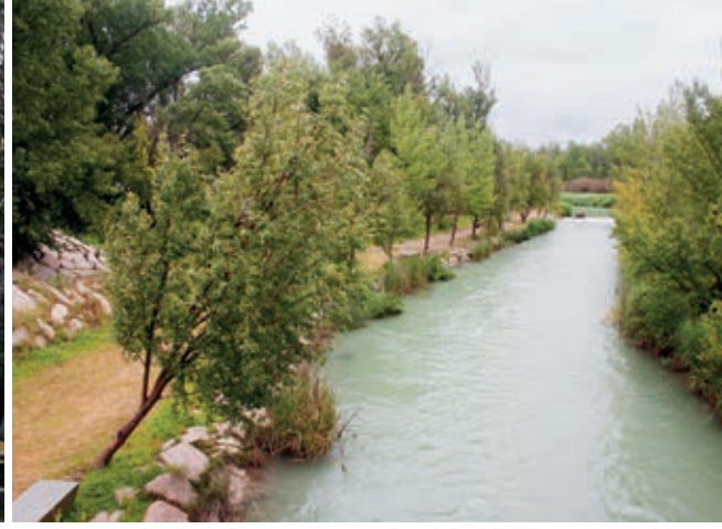
Parque Fluvial de Zuera.

representada por ciprínidos como lucio perca, tencas, carpas y madrillas. Destacan en estas aguas la presencia del mejillón de río y del galápago europeo.