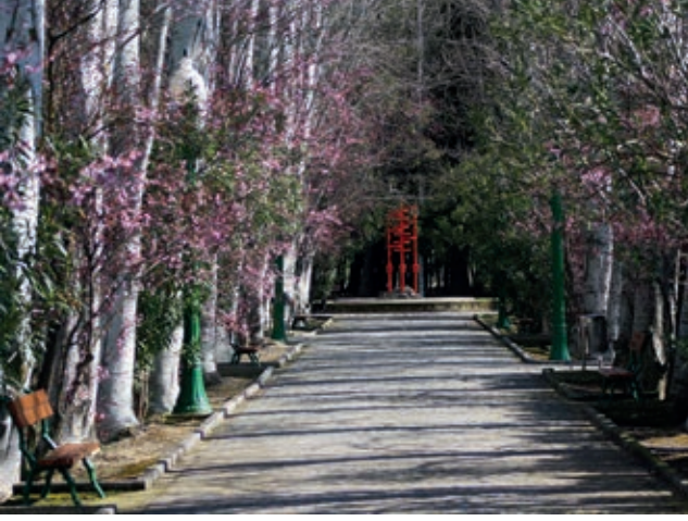
Complejo del Gállego.