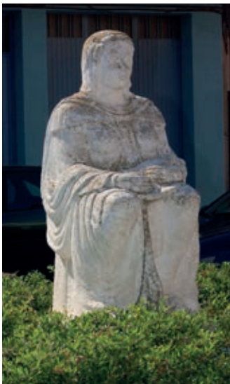
Dama de la Paz en Zuera.