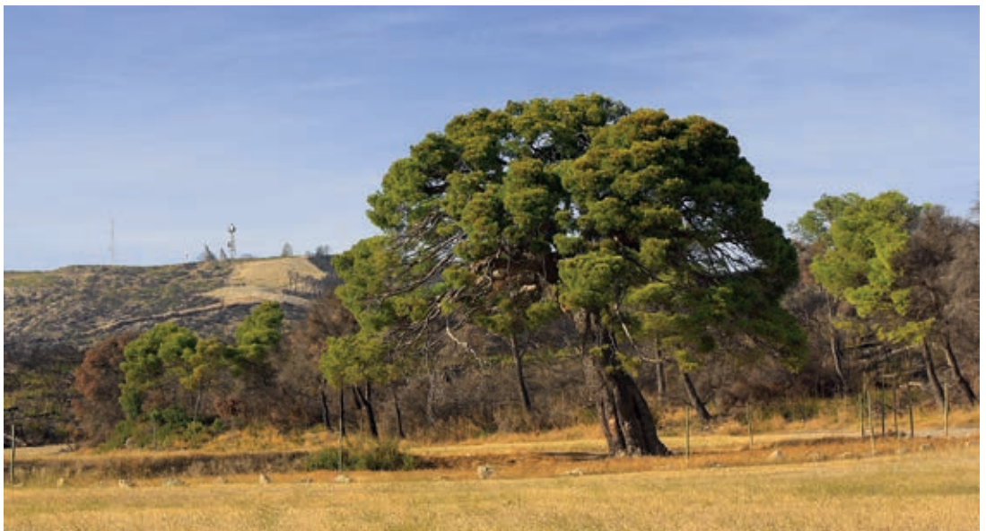
Pino de Valde Navarro.

Se trata de un conjunto forestal de características mediterráneas, dominado por la especie Pinus halepensis o pino carrasco.