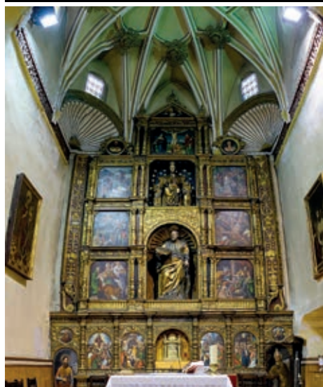
Iglesia de San Pedro Apóstol.