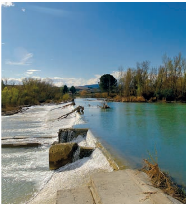
Azud de Camarera.

En las laderas de solana, exposición sur y zonas bajas, domina la asociación vegetal del pino carrasco con carrasca, coscoja, lentisco, con un sotobosque rico en especies aromáticas, espinosas y matorrales como jaras.