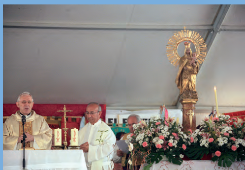
Misa aragonesa presidida por el Obispo de Tarazona.