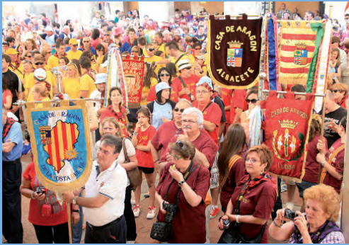
Bienvenida a las Casas y Centros asistentes.