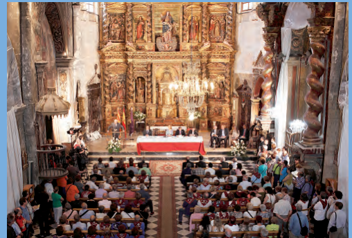
Vista del acto académico en la Iglesia de Santa María.