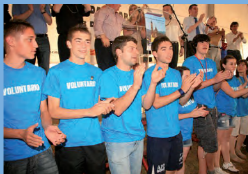
Jóvenes voluntarios del encuentro.