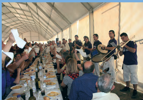
Comida de hermandad con más de 2.000 asistentes.