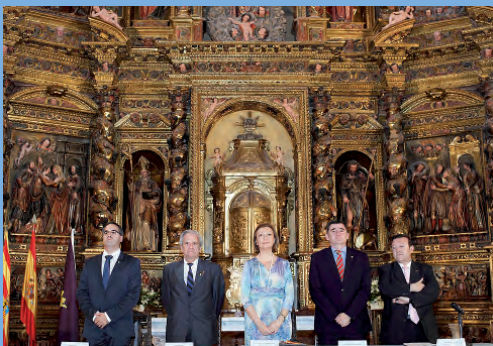
Autoridades presentes en el acto académico.