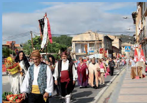
Tradicional ofrenda de flores y frutos.