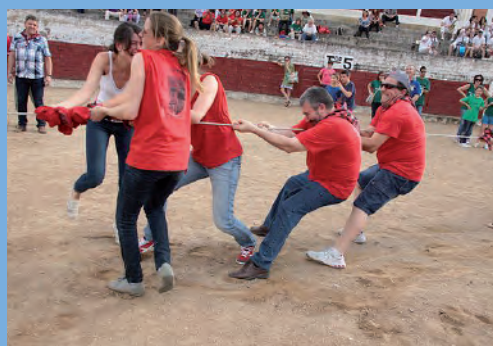
Celebración de juegos tradicionales aragoneses.