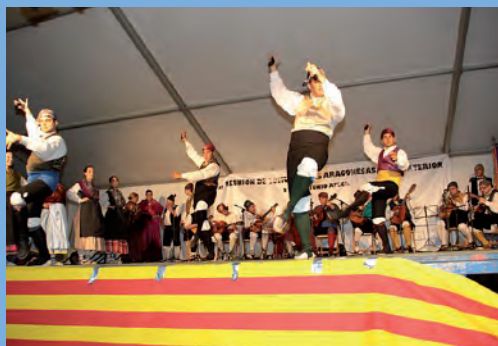
Momento del gran Festival Folklórico.