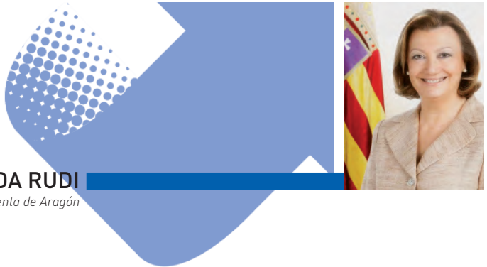
LUISA FERNANDA RUDI Presidenta de Aragón