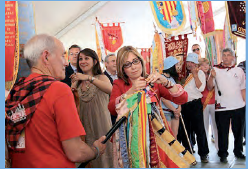
Encuentro a los Guiones e imposición de bandas conmemorativas.