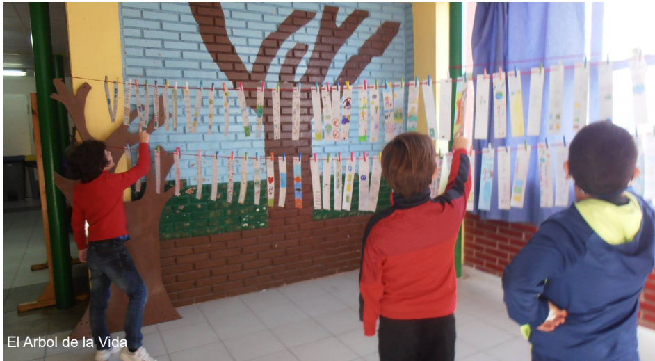
El Arbol de la Vida