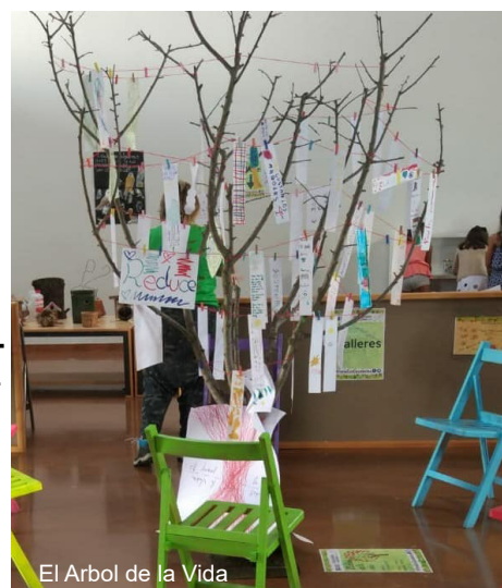
El Arbol de la Vida