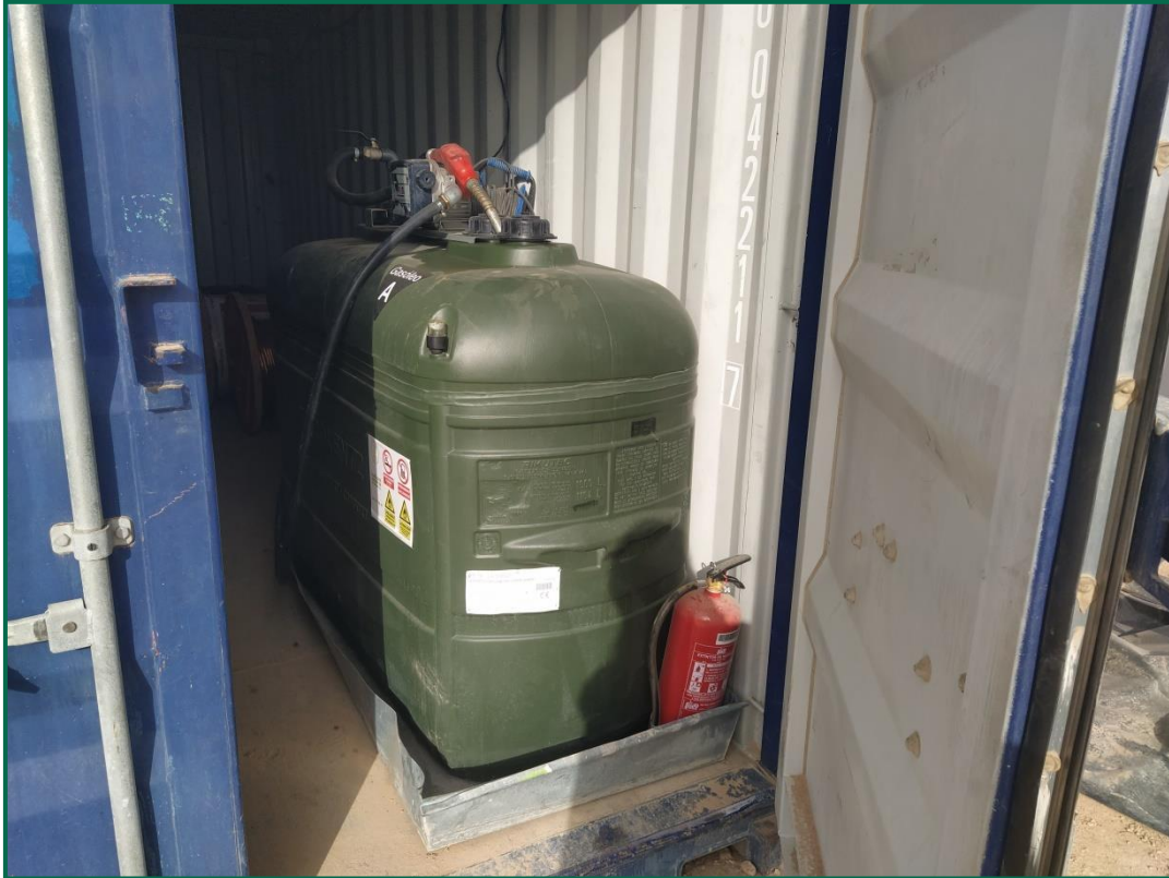
Fotografía 6. Depósito de combustible y extintor.

Se dispone de extintores tanto en la zona de casetas como en la zona de obras.