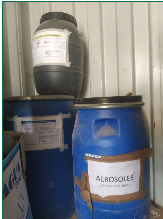
Fotografía 4. Bidones etiquetados.

Se ha habilitado una zona preparada para realizar el lavado de las canaletas de las hormigoneras que trabajan en la obra, con protección para evitar infiltraciones, lleva instalada desde el mes de noviembre, cuando comenzó el hormigonado y todavía no se ha llenado , se vaciara cuando se llene y al concluir la obra.