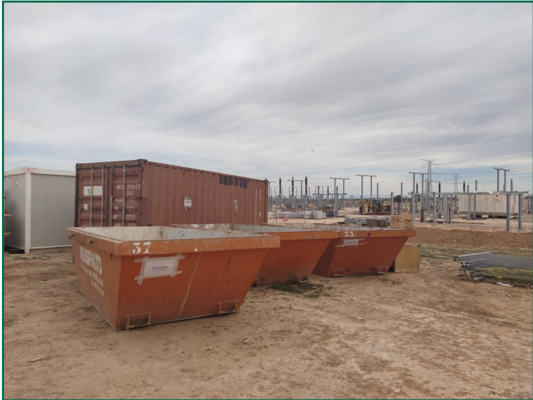
Fotografía 3. Contenedores de residuos inertes.