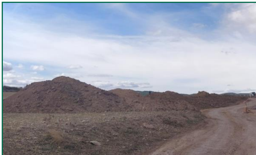
Fotografía 1. Caballones de tierra acopiados.

La tierra vegetal sobrante se ha acopiado en caballones para su conservación de cara a la futura restauración posterior.