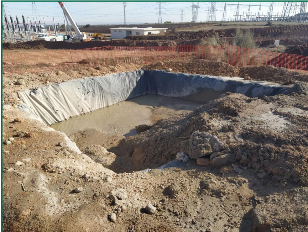
Fotografía 5. Zona de lavado de hormigoneras.