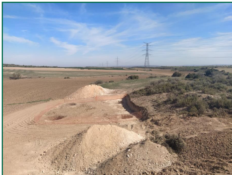
Fotografía 2. Zona con vegetación natural junto a excavación de apoyo 1.

El elemento de la obra más próximo a vegetación natural es el Apoyo 1 de la LAAT, ya se ha realizado la excavación y no se ha afectado esta vegetación.