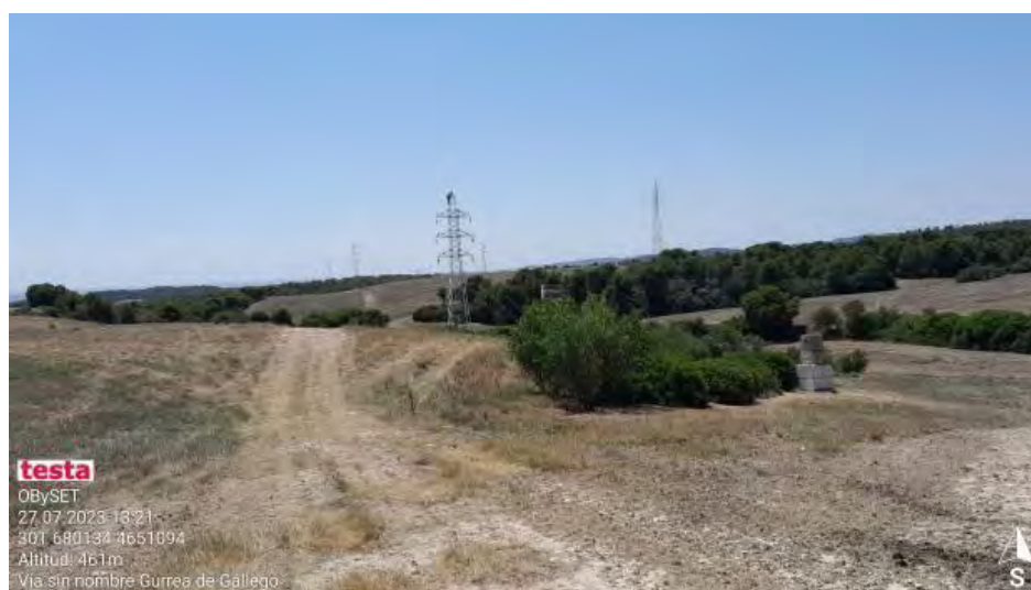
Avances en Lat