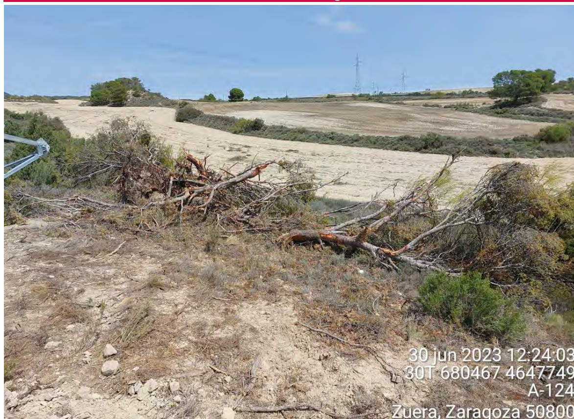
Imagen 1. Restos de los pinos arrancados que deben ser retirados cuanto antes.