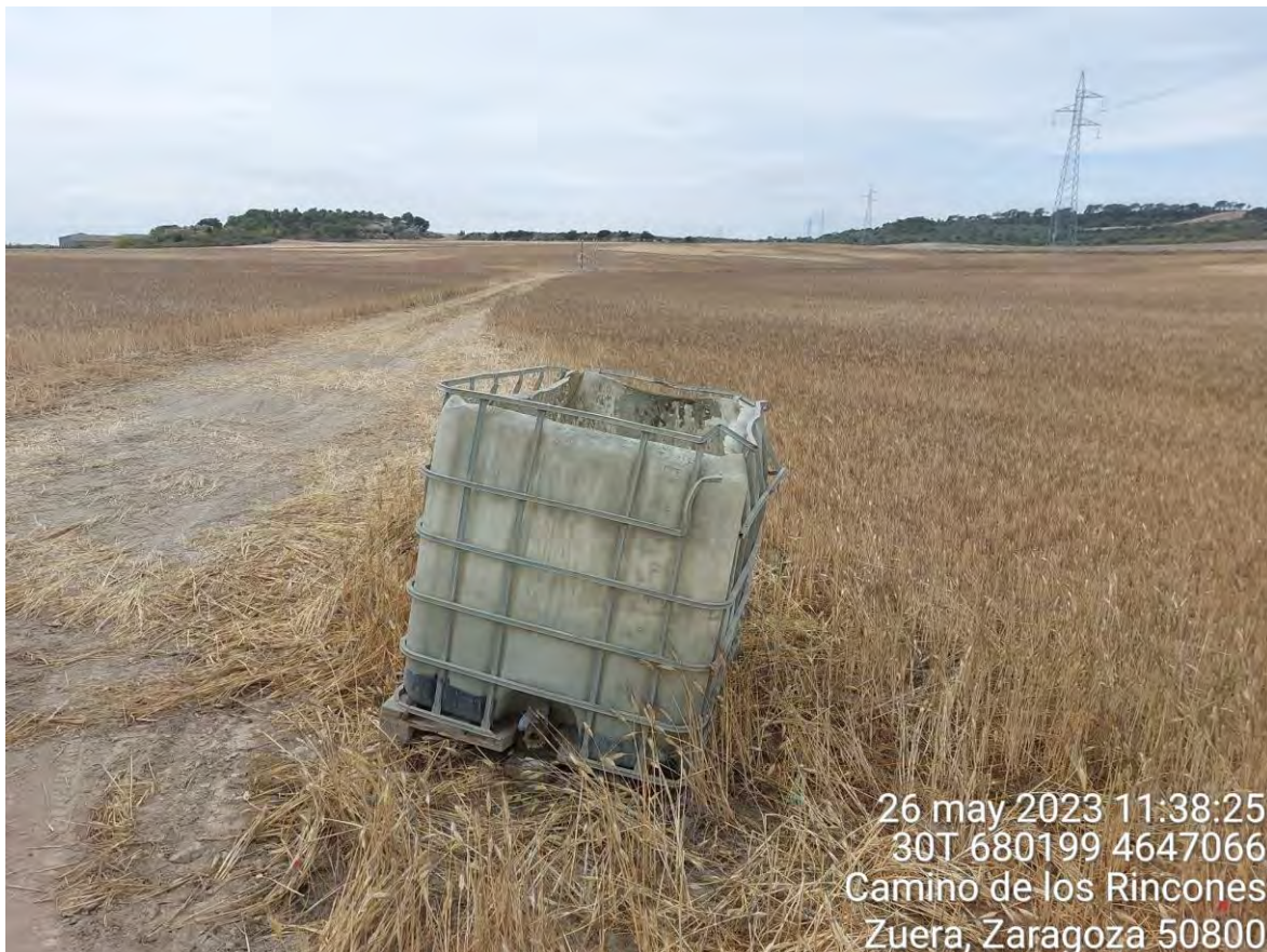
Imagen 2. Depósito utilizado para realizar lavados.