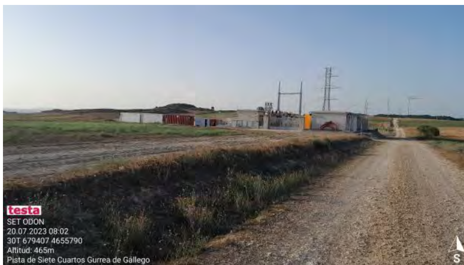
Restauración de zanja Lat.