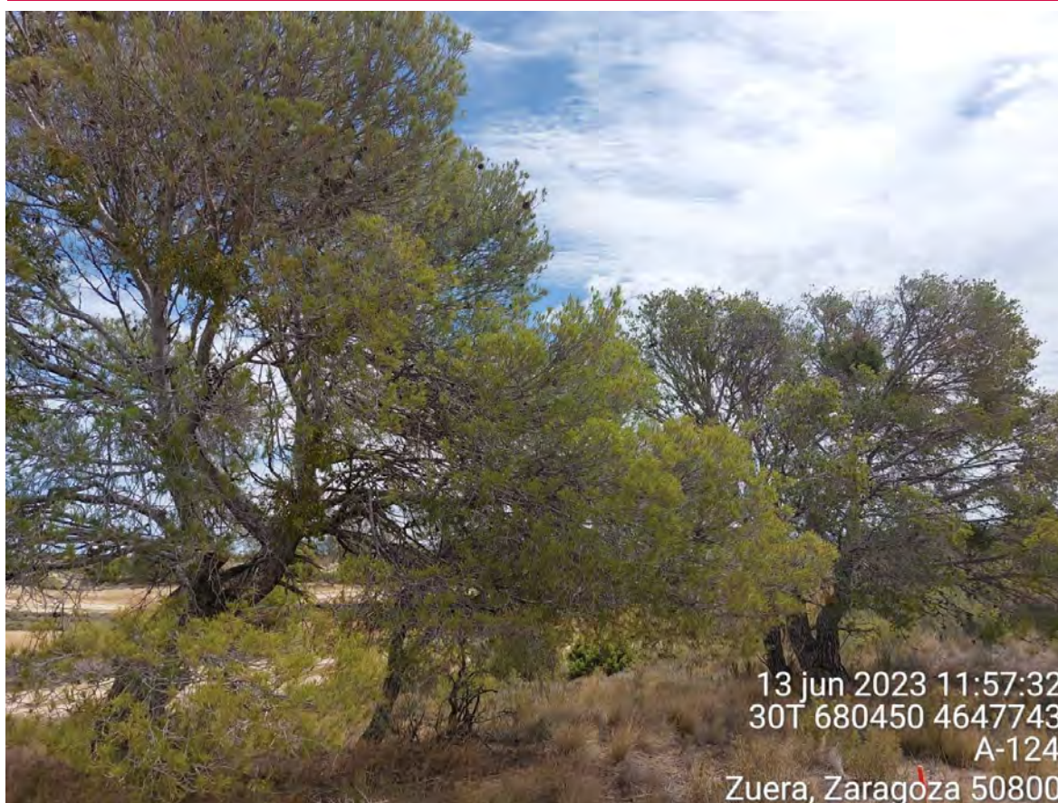
Imagen 1. Pinos que se van a arrancar en el apoyo 71 de la LAT.