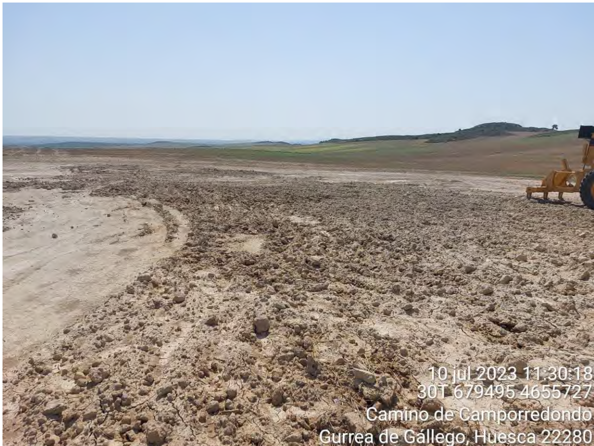
Imagen 1. Zona de la SET en la que se encontraba el material de excavación y el pozo de lavado.