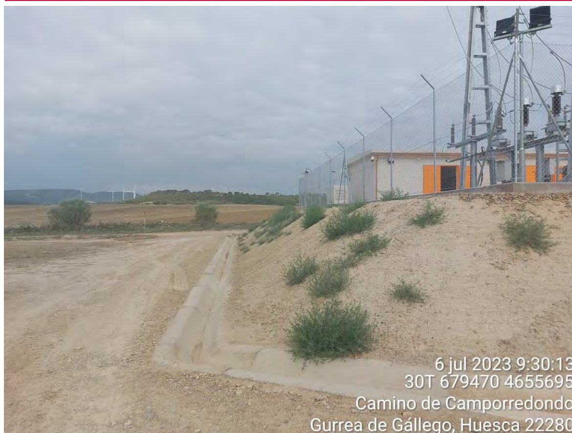
Imagen 1. Talud de la SET que se deberá tratar con hidrosiembra sobre malla.