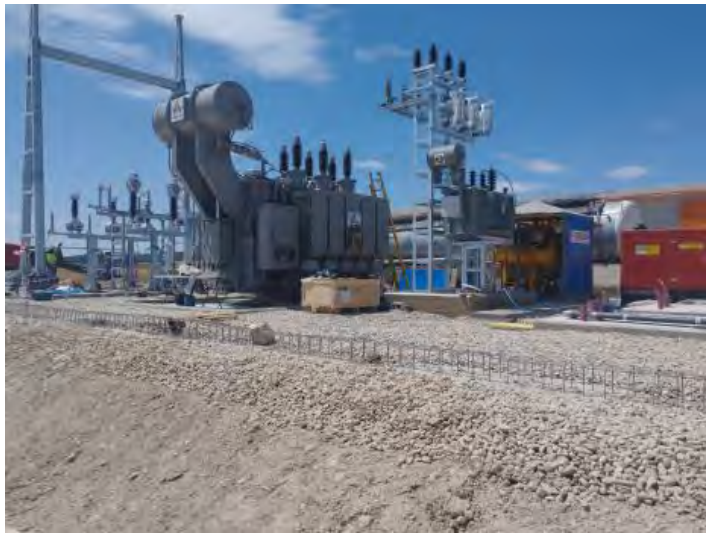
Avances en SET