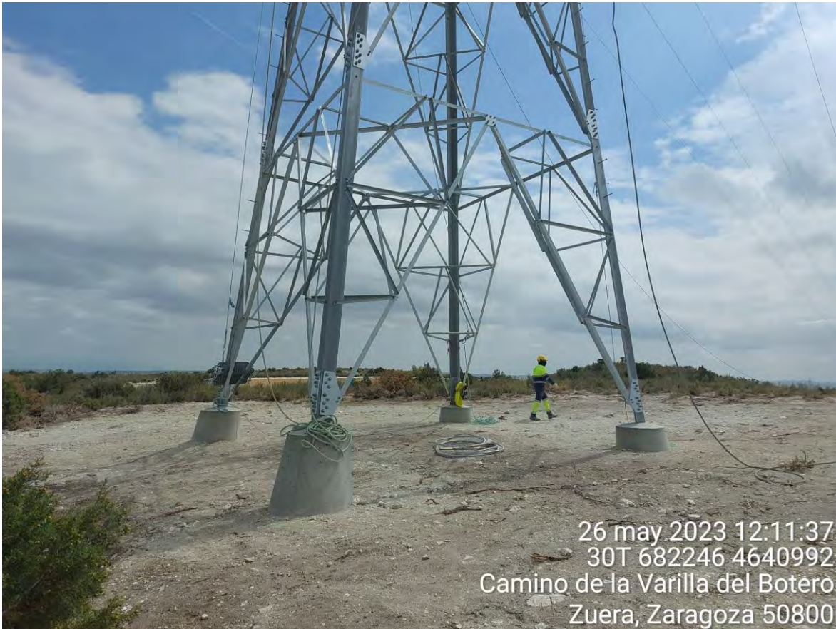
Imagen 1. Trabajos en apoyo de la LAT