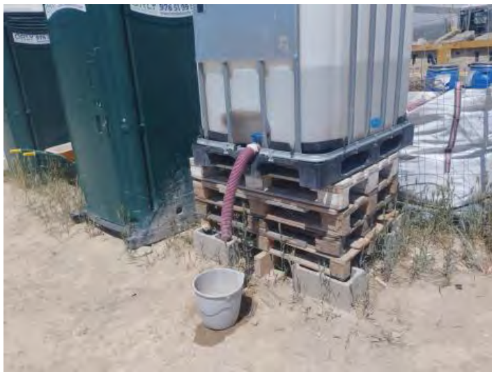
Almacenaje de líquido sin etiquetar.