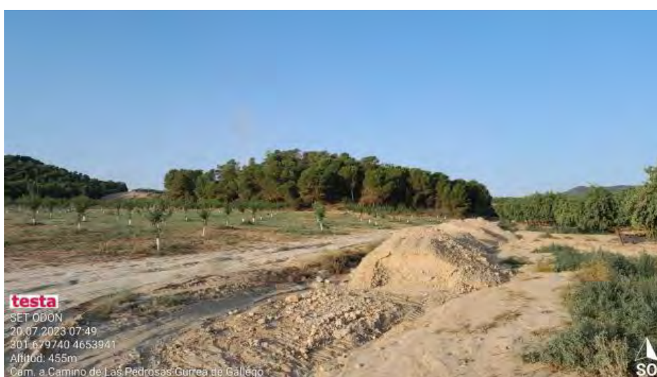
Acopio de tierras en Lat.