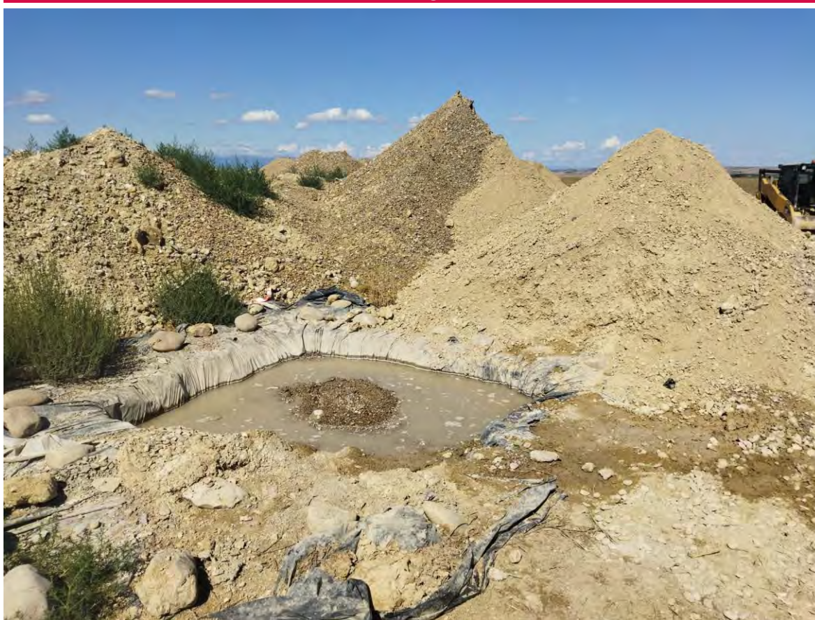
Imagen 1. Pozo de lavado tras separarlo de la tierra.