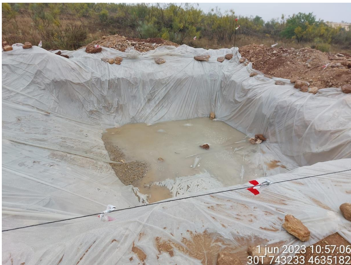
Imagen 3. Pozo de lavado en SC2-01 en buenas condiciones tras ser utilizado.