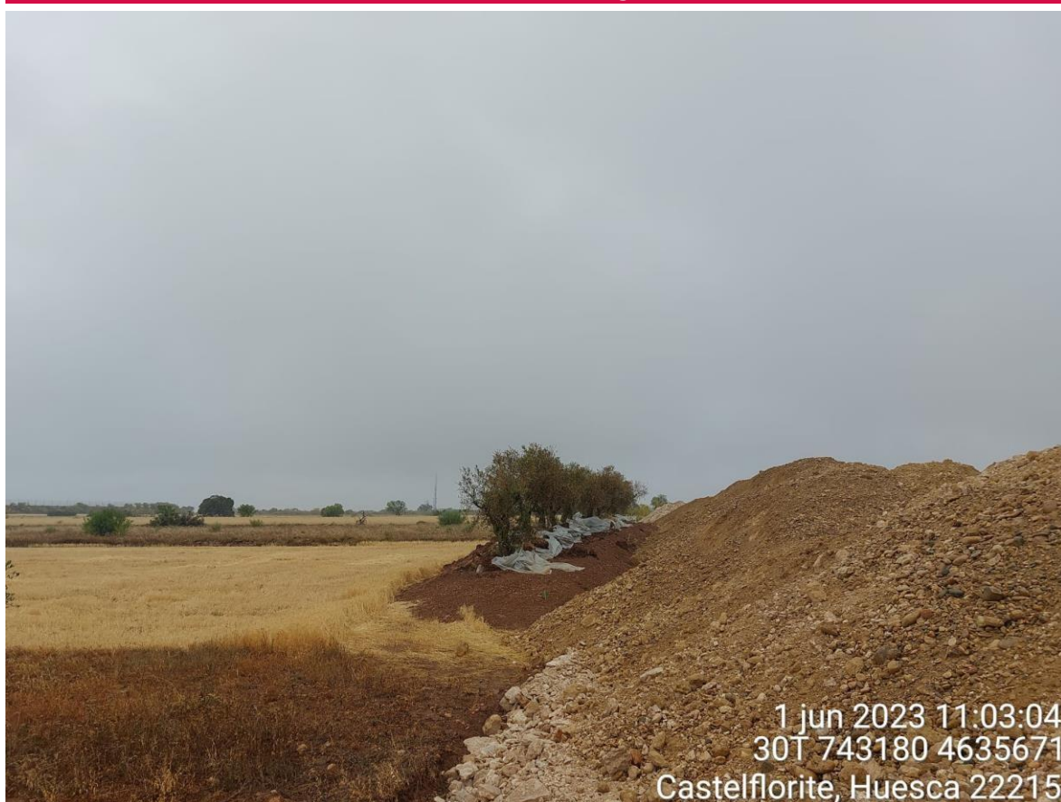
Imagen 1. Olivos arrancados y colocados en los límites de la posición SC2-01.