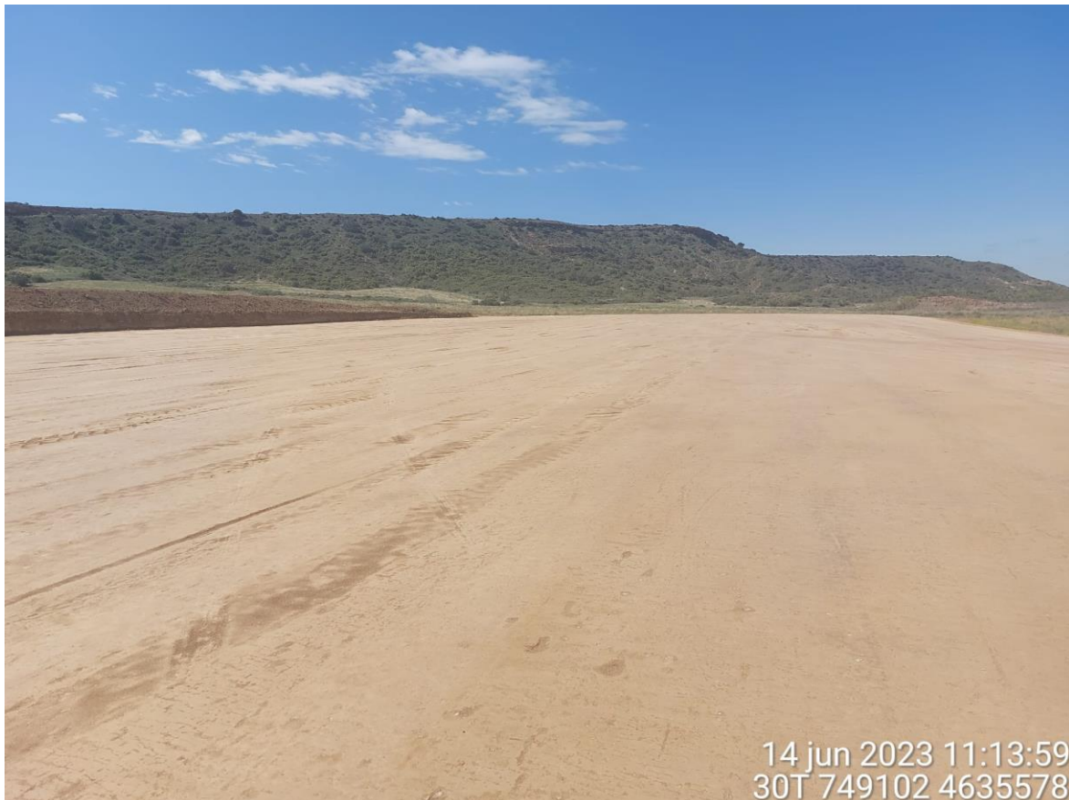
Imagen 4. Explanada correspondiente con la SET de SC1.