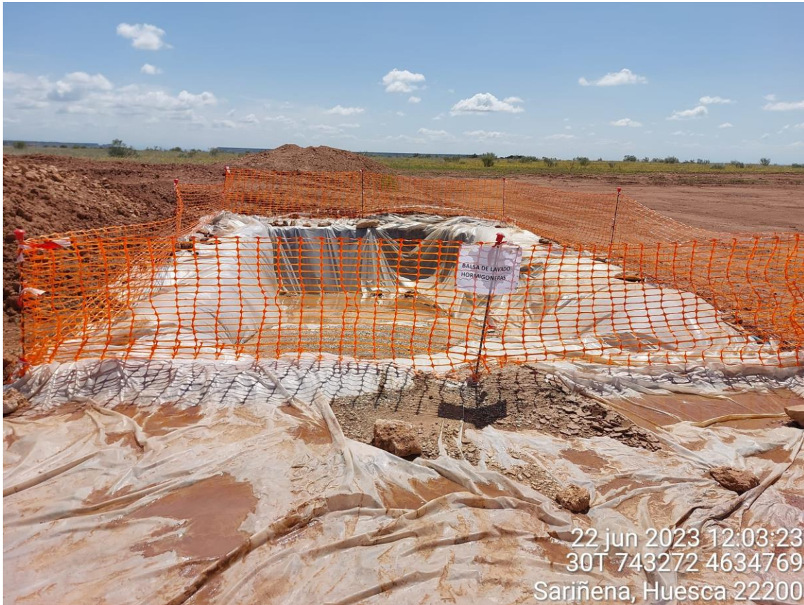
Imagen 1. Pozo de lavado en buenas condiciones