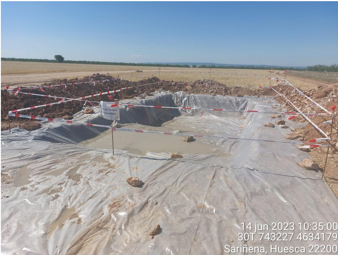
Imagen 1. Pozo de lavado en SCA-01 en buenas condiciones.