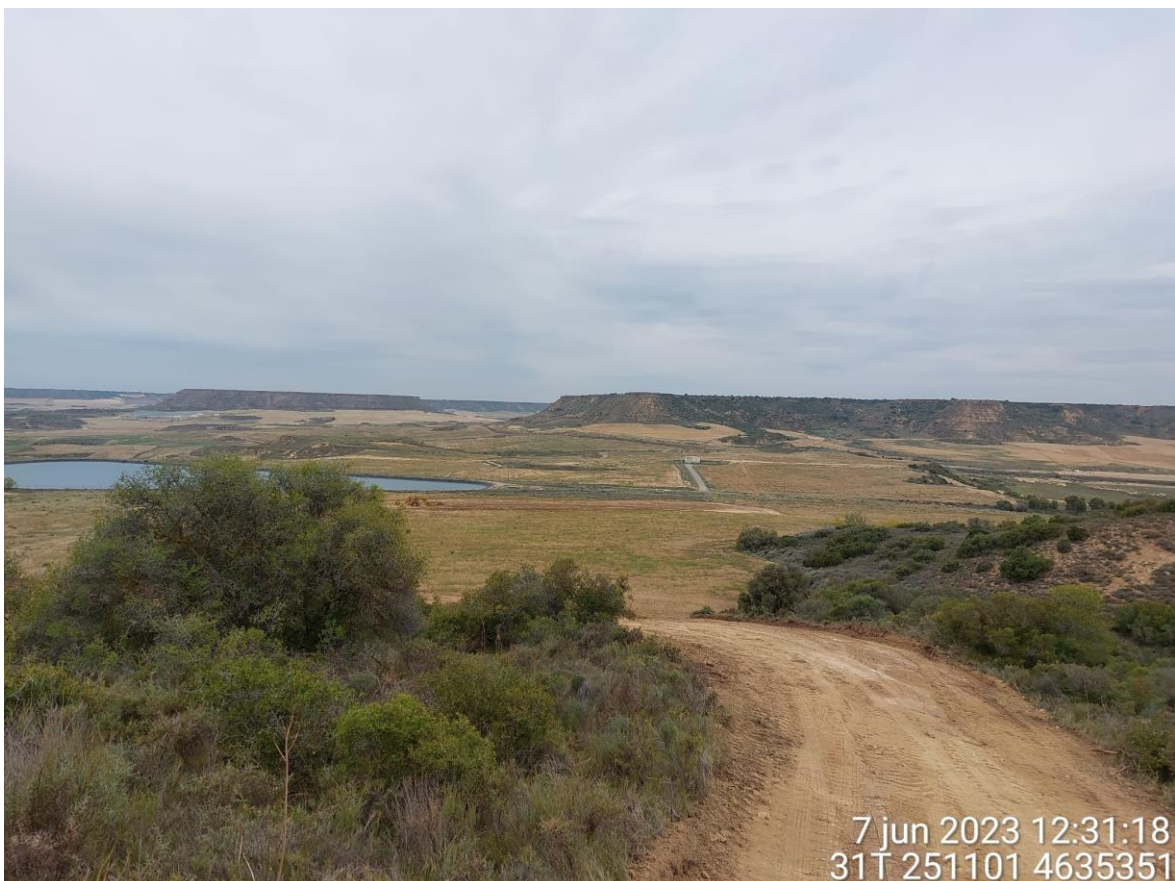
Imagen 2. Desbroce en el vial de SC1 conflictivo.