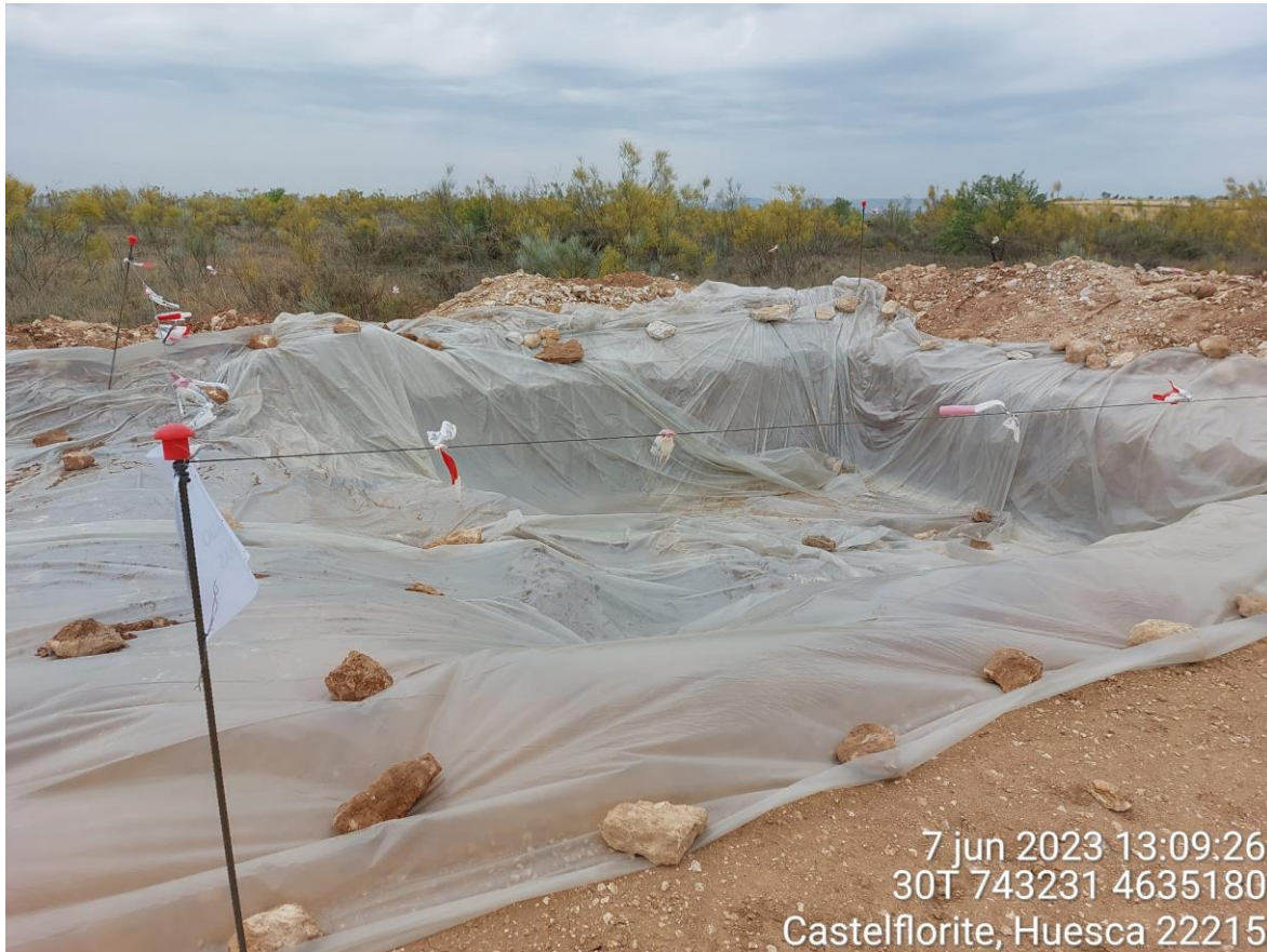
Imagen 3. Pozo de lavado en buenas condiciones.