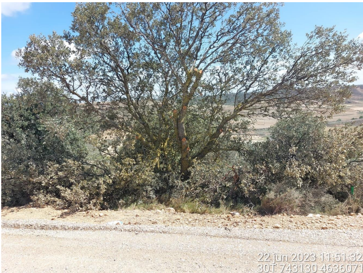
Imagen 2. Carrasca podada en función de la consulta realizada a los APNs.