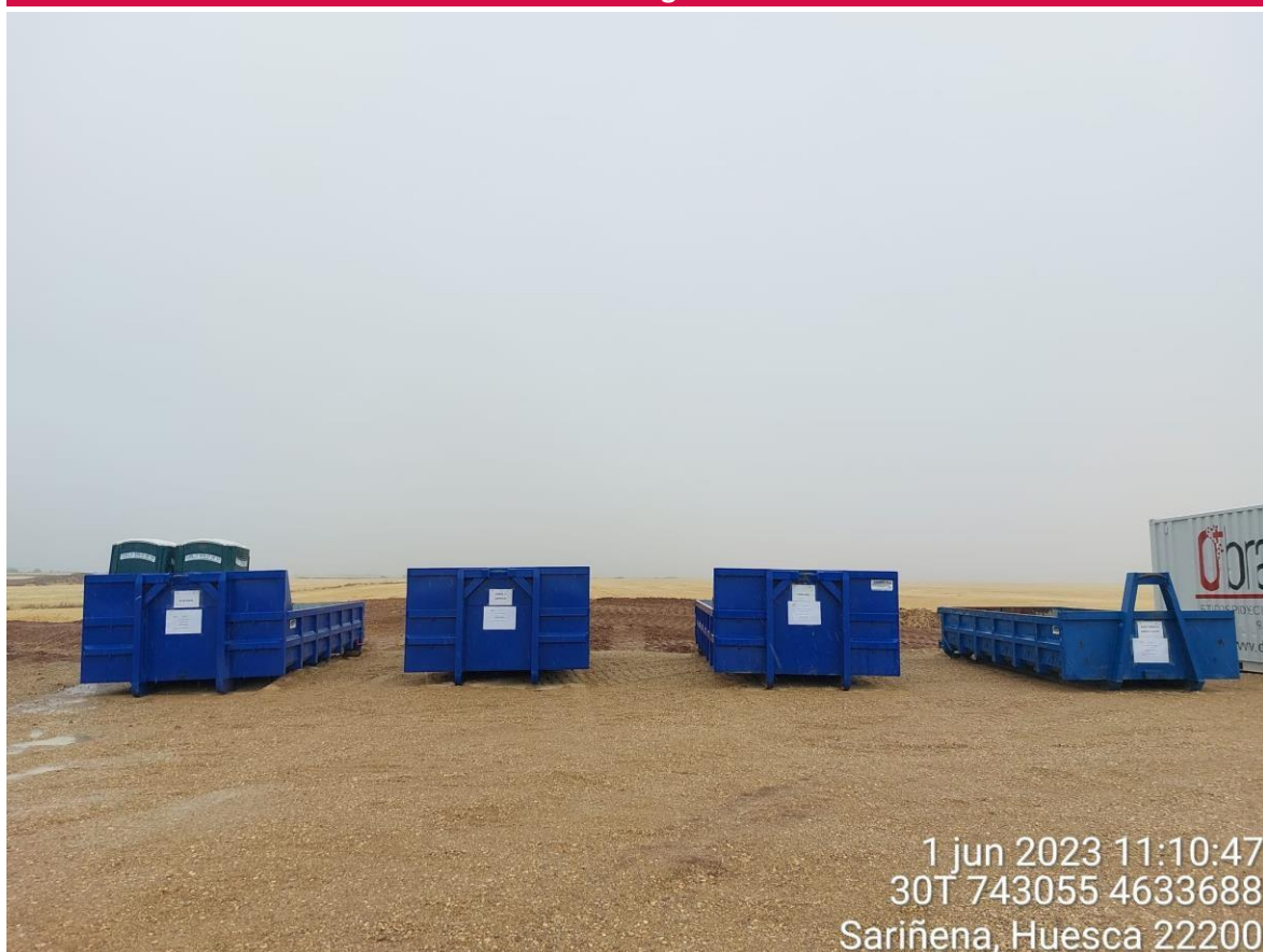
Imagen 2. Contenedores de RP colocados y etiquetados en la zona del punto limpio.