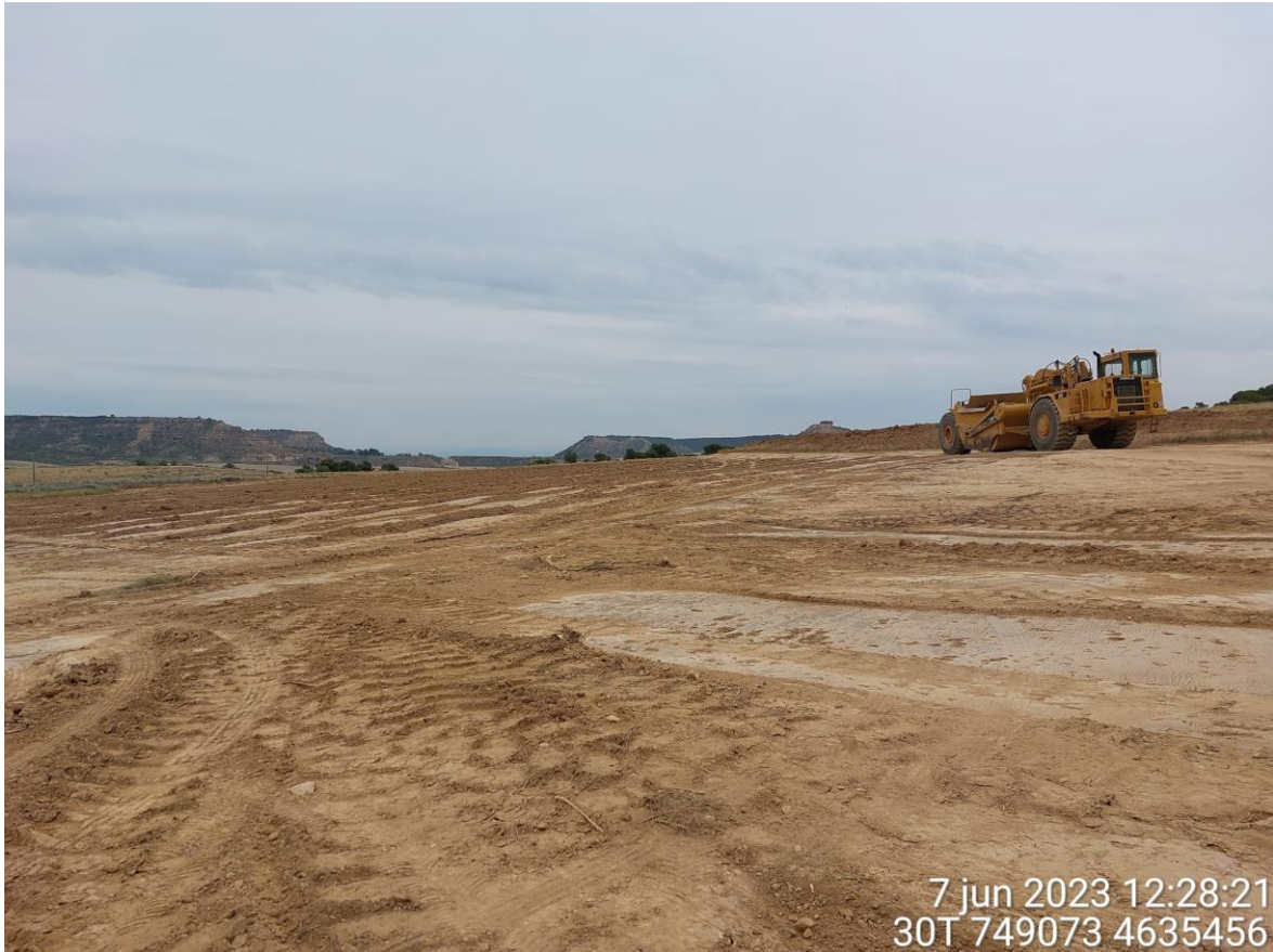
Imagen 1. Desbroce en SCI-01.