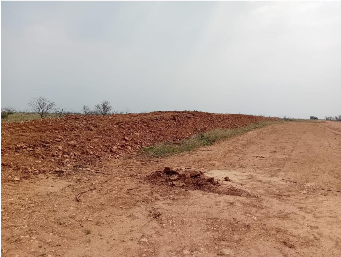
Imagen 3. Separación de la tierra vegetal realizada del modo correcto en SC1.