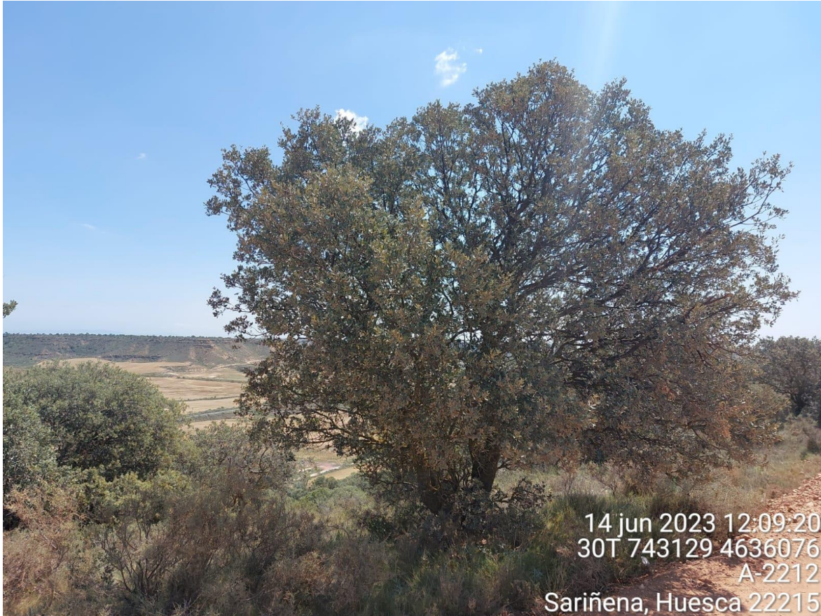
Imagen 3. Carrasca que se debe podar para ensanchar vial según proyecto.