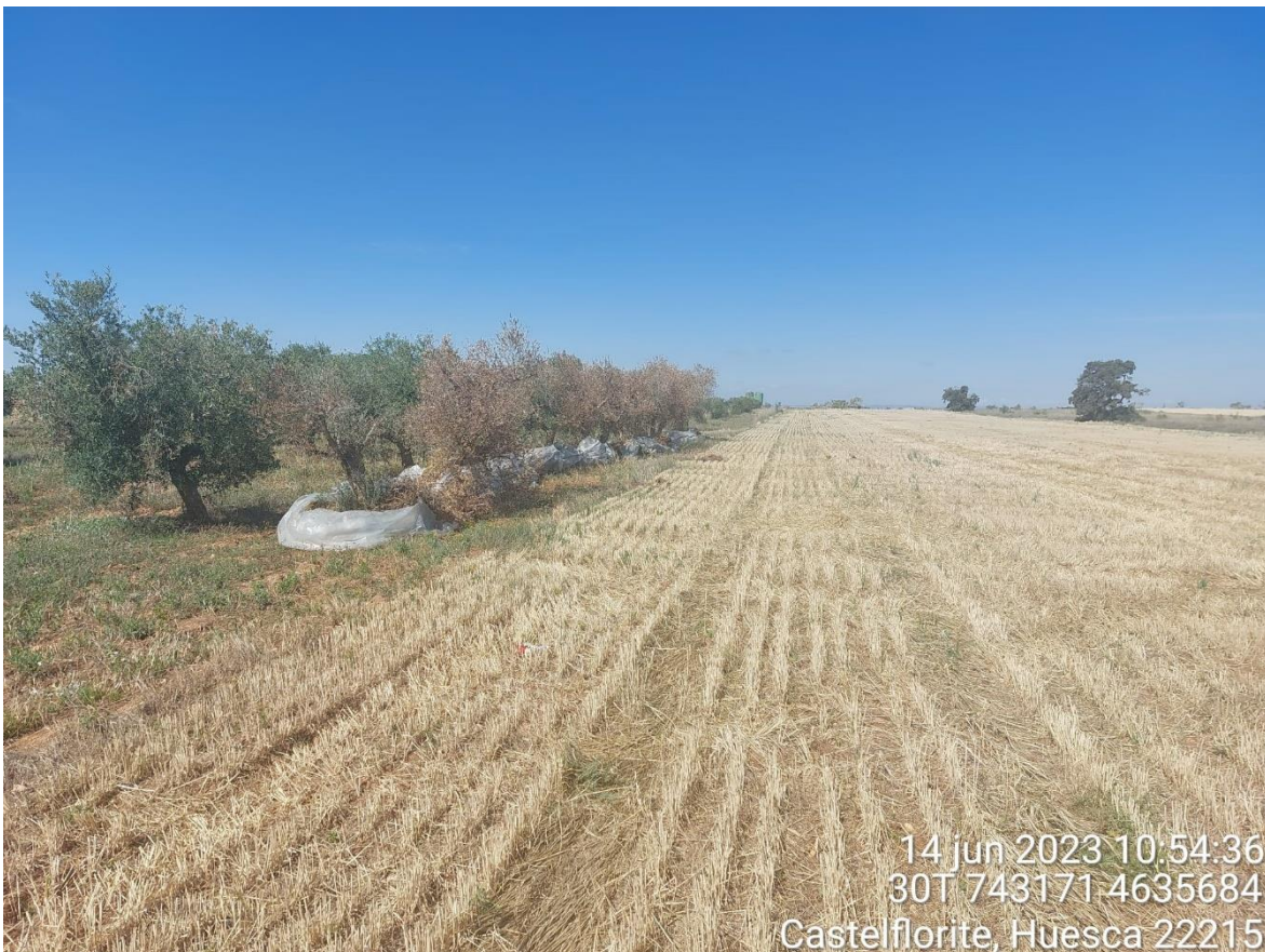
Imagen 2. Olivos colocados fuera de obra en parcela del propietario.