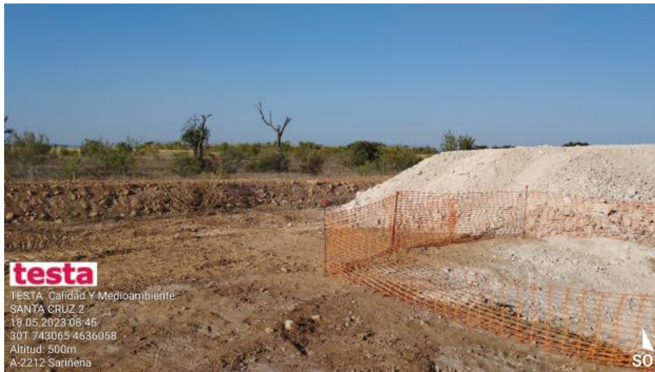
Separación de tierras