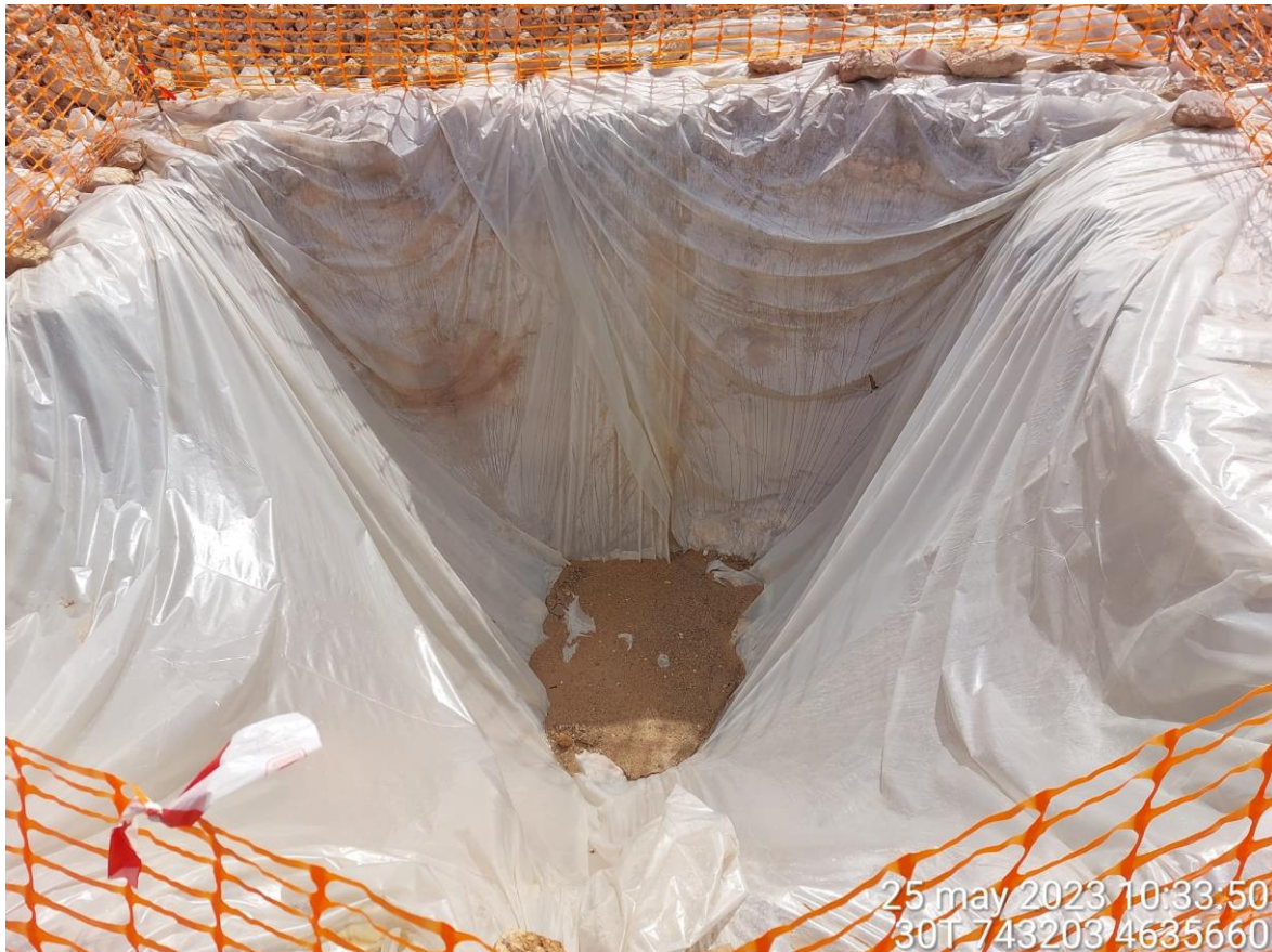
Imagen 4. Pozo de lavado en buenas condiciones para realizar lavados.