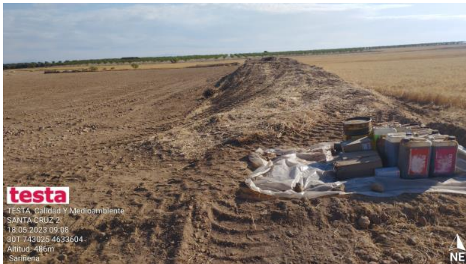
Acopio de residuos