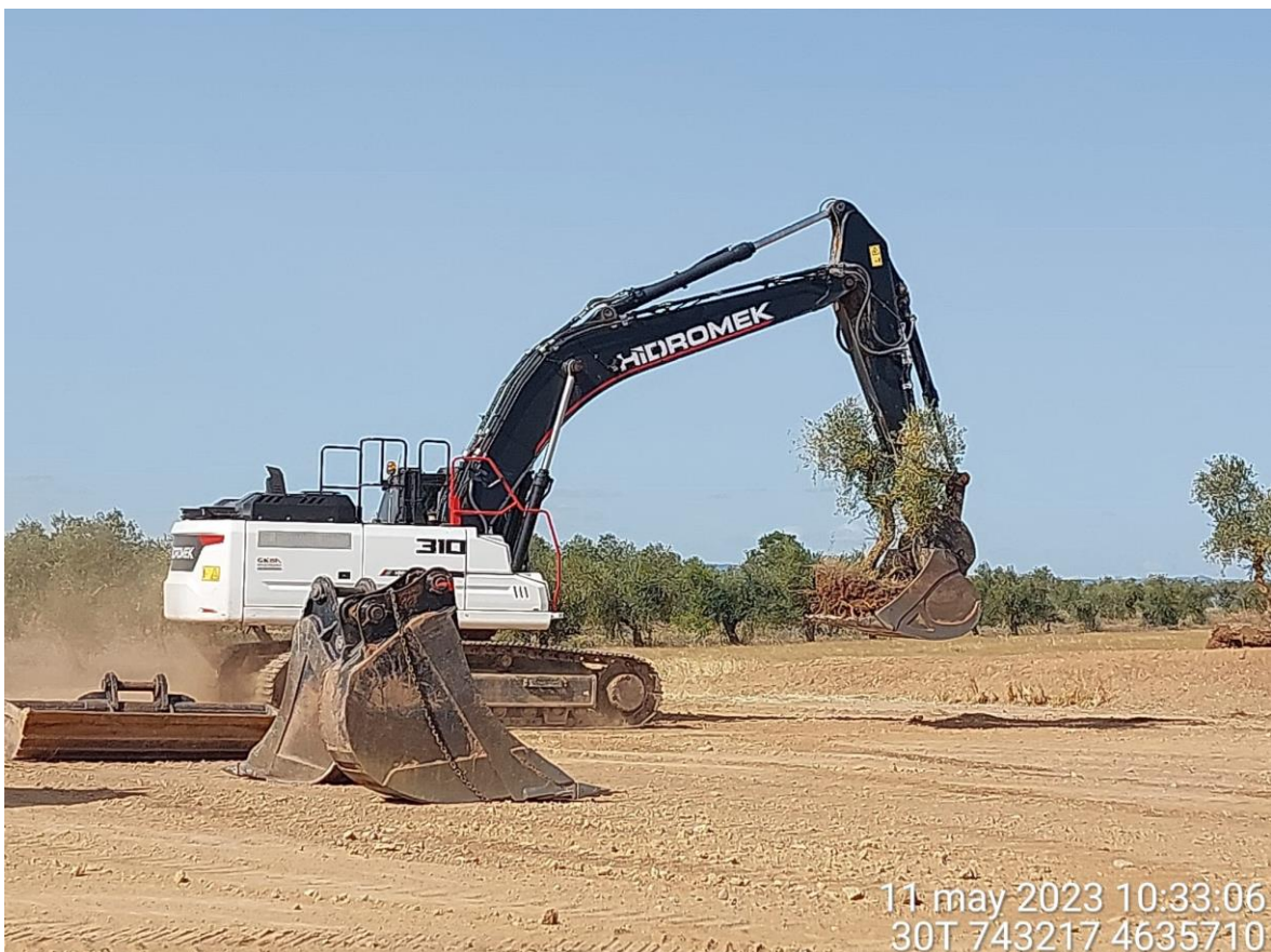
Imagen 4. Maquinaria transportando ejemplares arbóreos tras su arranque.