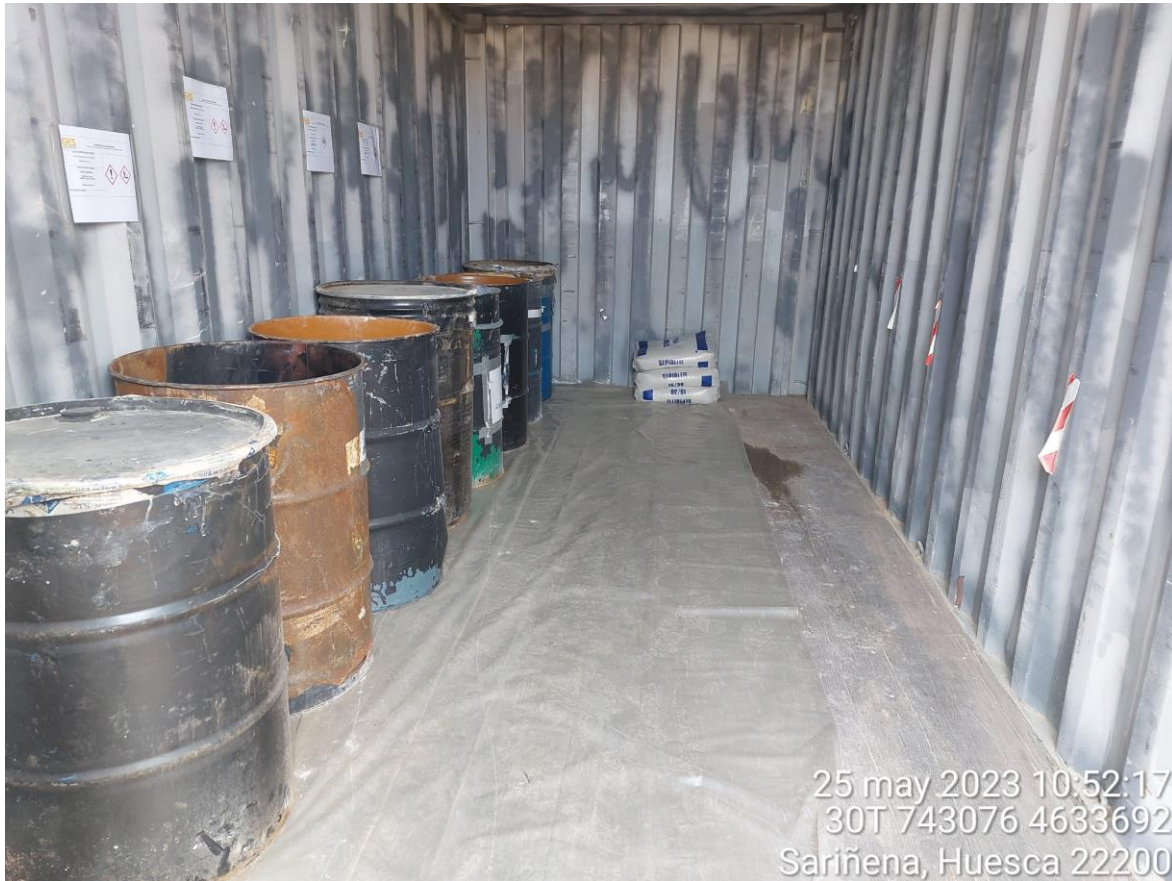
Imagen 2. Almacén de RP en buenas condiciones y con el etiquetado correcto.