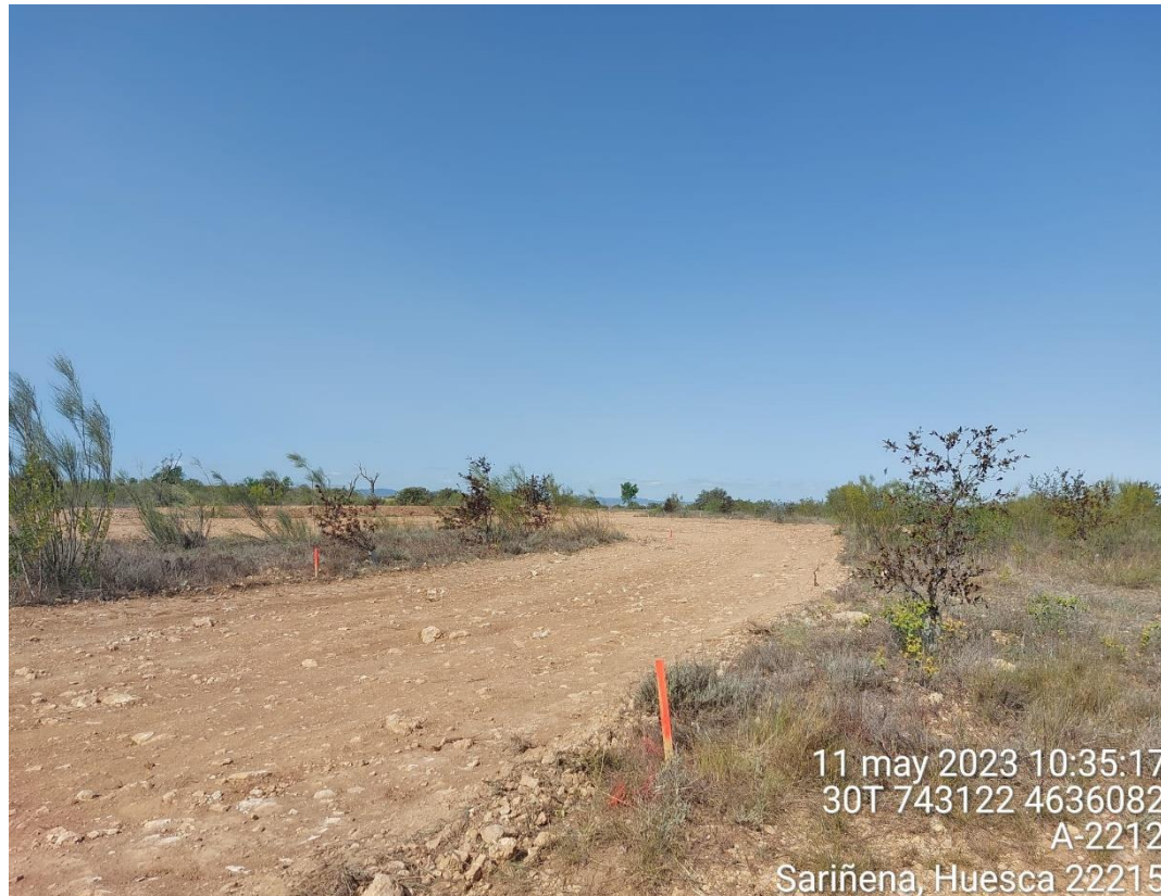
Imagen 2. Estaquillado en SCII.