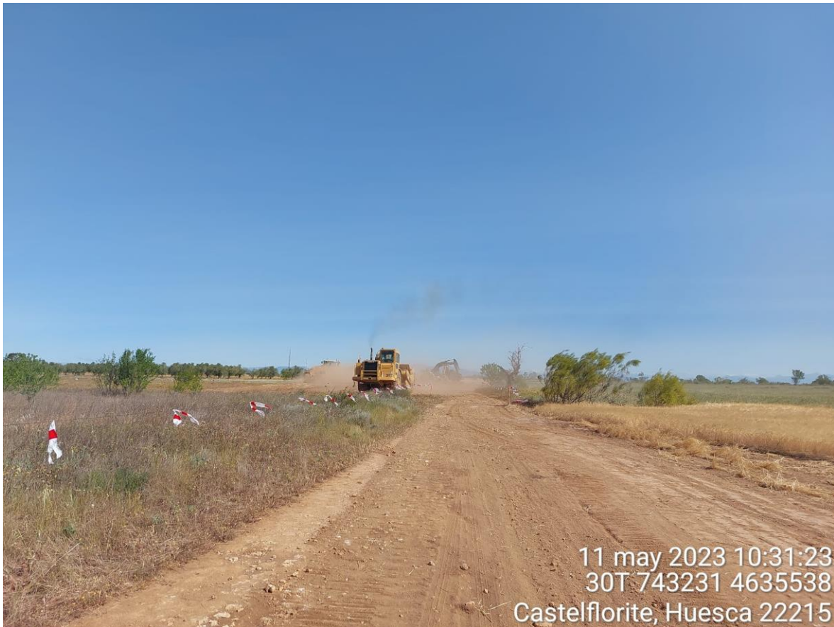
Imagen 3. Maquinaria trabajando en SCII.