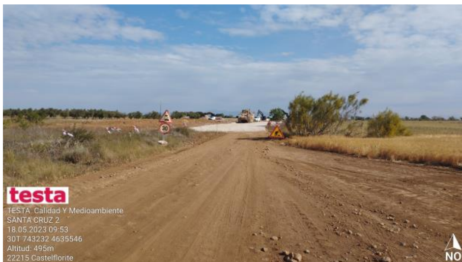
Apertura de viales y plataformas.