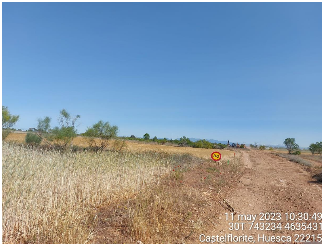
Imagen 1. Señalización de máxima velocidad en obra.