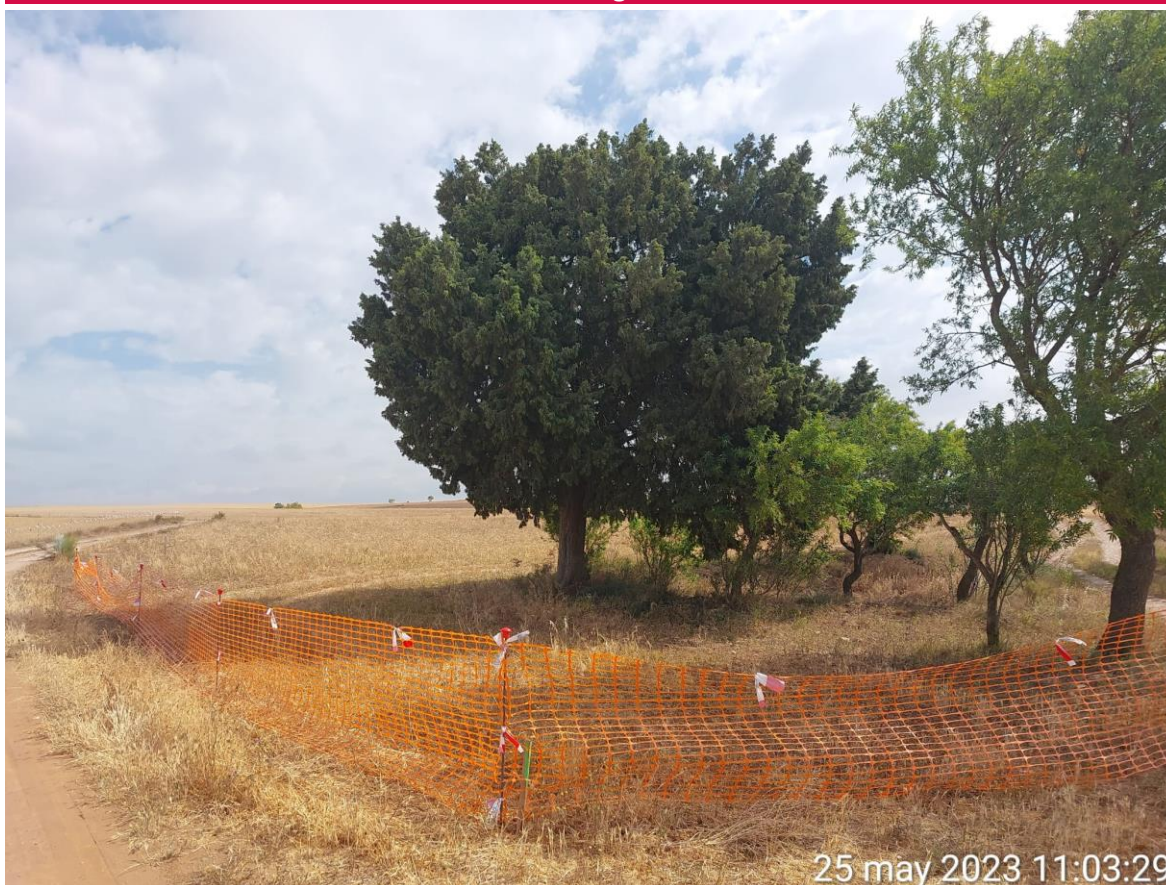
Imagen 1. Ejemplar de Juniperus balizado debido a su cercanía al límite constructivo de la obra.