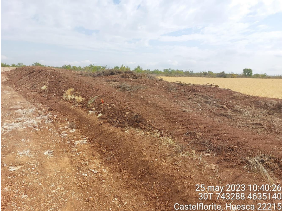
Imagen 3. Cordón de tierra vegetal acopiado correctamente.