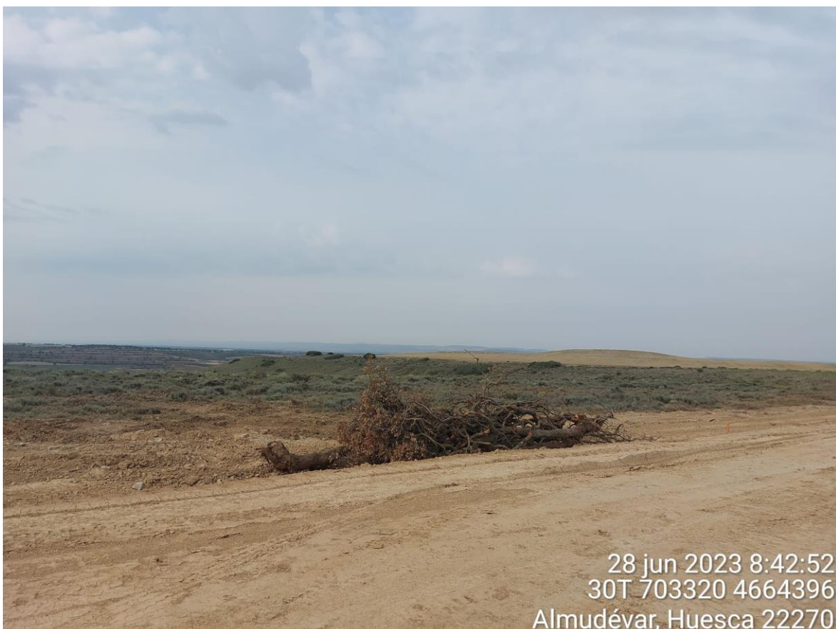
Imagen 2. Material vegetal extraído en trabajos de desbroce que se debe retirar cuanto antes.