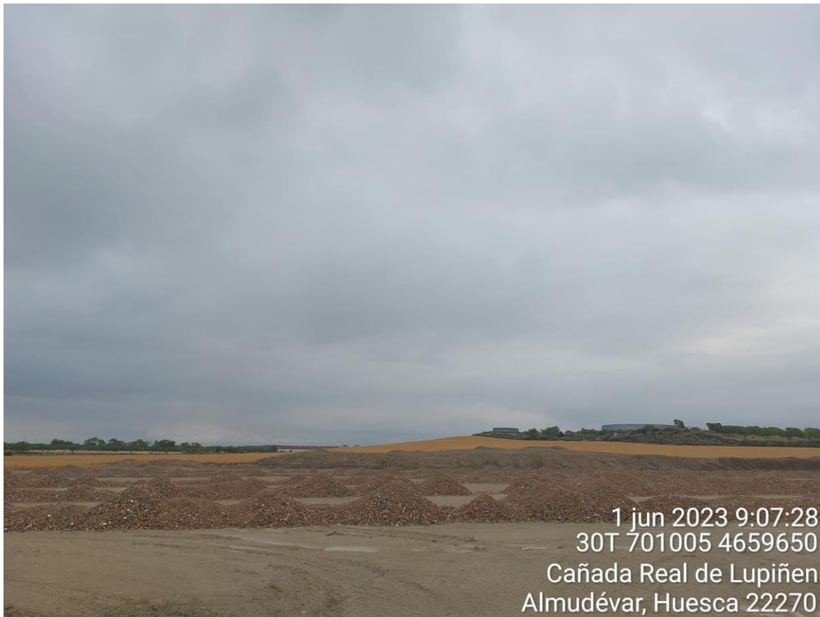
Imagen 1. Zahorra para extender en la zona del site camp.