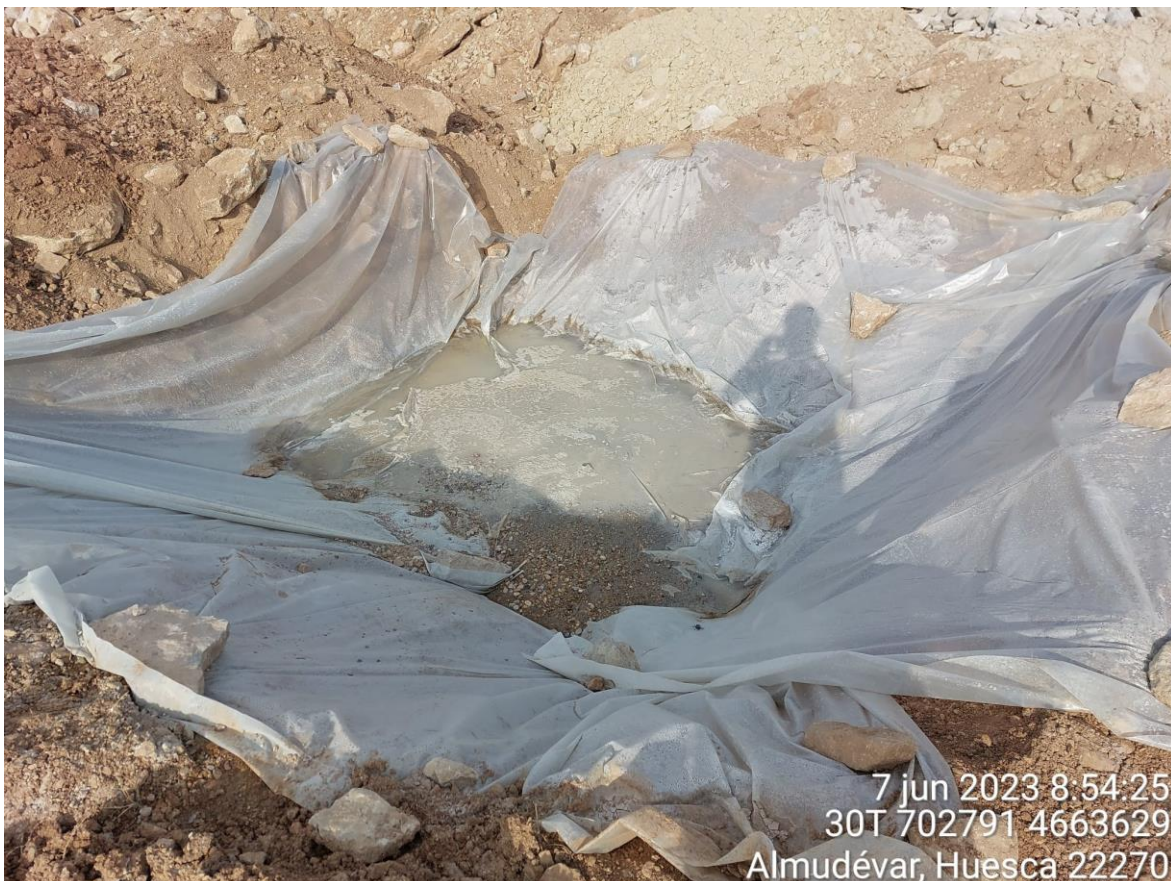
Imagen 2. Pozo de lavado que debe mejorarse para trabajos de hormigonado de zapatas.