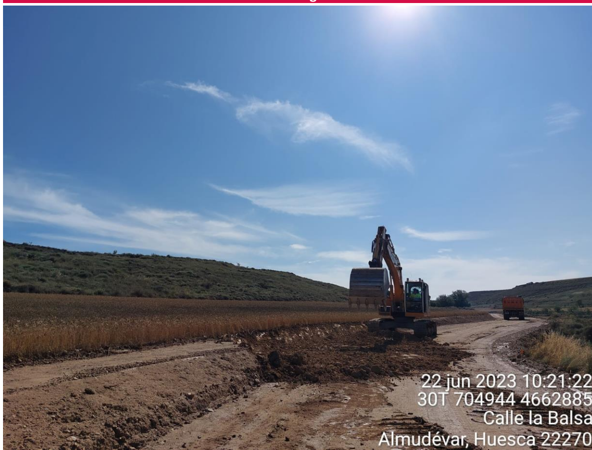
Imagen 2. Movimientos de tierra en vial hacia los aerogeneradores 7 y 8.