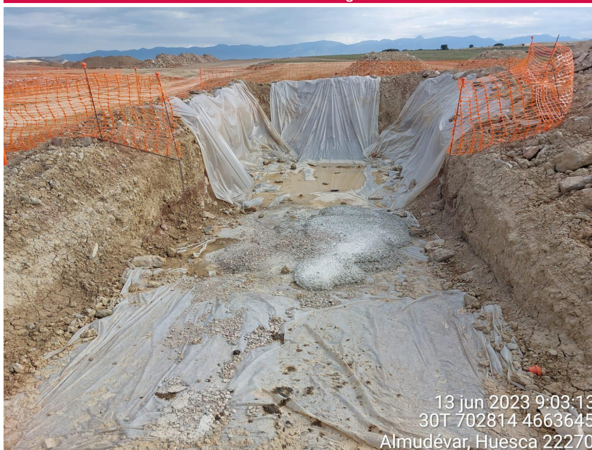
Imagen 1. Pozo de lavado de SIS-01 que debe recubrirse con plástico completamente.