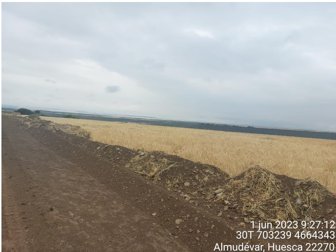
Imagen 2. Correcta separación y acopio de la tierra vegetal.