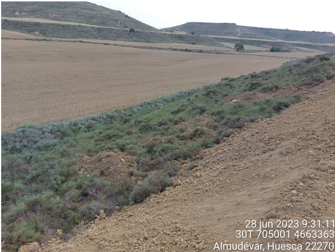
Imagen 1. Tierra vegetal mal acopiada.