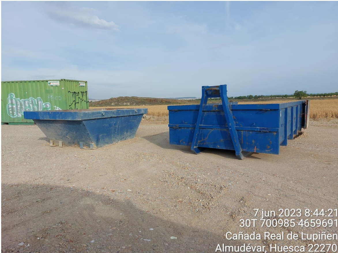
Imagen 3. Campa de acopio en la que se debe instalar y adecuar el punto limpio.