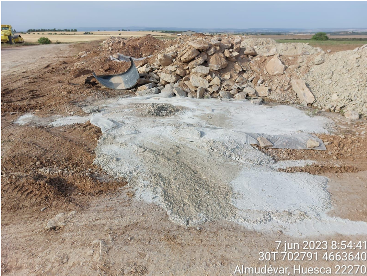
Imagen 1. Contaminación del suelo por residuo de hormigón en SIS-01. Se corrige inmediatamente.