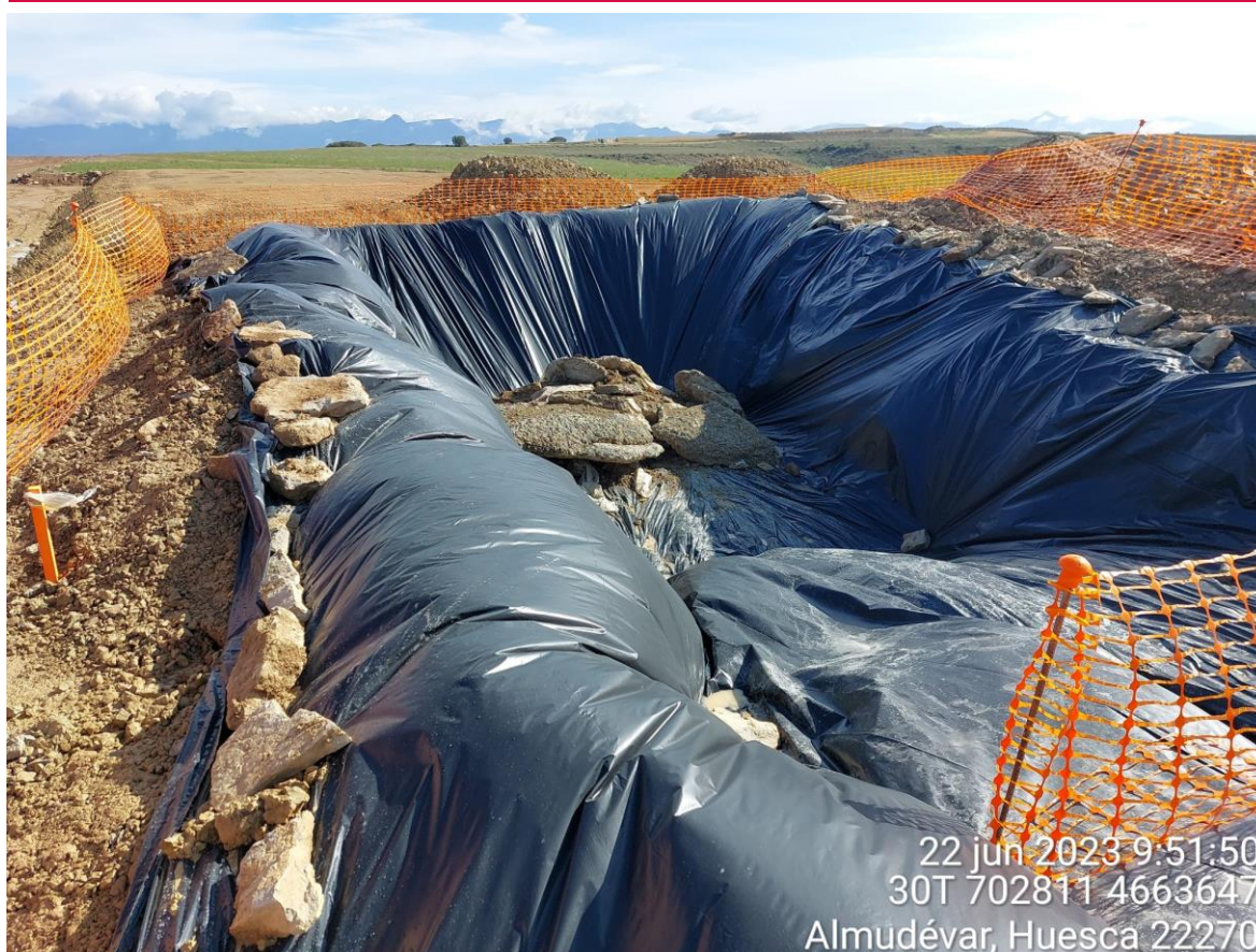
Imagen 1. Pozo de lavado en buenas condiciones en SIS-01 tras realizar las correcciones indicadas.